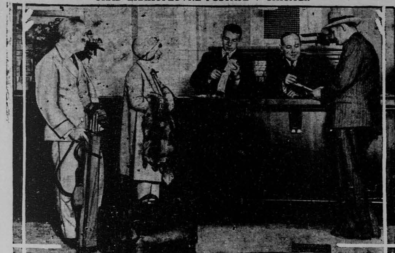
Slika predstavlja urad centralne zrakoplovne postaje, kjer potniki kupujejo vozne liste za zrakoplovno vožnjo. Potniški zrakoplovni promet zelo narašča. Urad se nahaja v znanem poslojpu Palmer House.