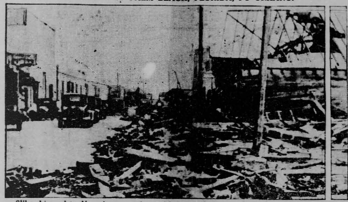
Slika, ki predstavlja prizor po orkanu, ki je popolnoma razdejalo mesto West Palm Beach, v Floridi, je bila poslana potem brezzičnega brzjava in je prilično še dovolj jasna.