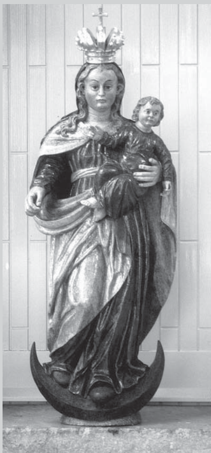
□ Slika 4. Marijin kip po rekonstrukciji manjkajočih delov in integraciji barvne plasti

levo ramo. V zgornjem delu leve Marijine roke je bila opazna sled dveh vzdolžnih žaginskih rezov. Eden je imel gladko površino, drugi pa volnato. Volnatost je nakazovala tenzijski les, ki se pojavlja na zgornji strani vej oz. nagnjenih debel. Radialne površine, vidne zaradi žaganja, smo lahko opazovali tudi na hrbtne strani Jezusa. Potek aksialnih elementov je bil zavrit. Širine branik na lokaciji leve Marijine roke so se ujemale s širinami branik na hrbtne strani Jezusa. Na sprednji strani Marijinega plašča je bila v lesu opazna vključena skorja (slika 3b), ki smo ji lahko sledili v stopalo Jezusove desne noge. Imela je tipično anatomsko zgradbo lipove skorje. Na sprednji strani Marijinega plašča smo opazili tudi vraslo grčo premera 13 mm. Vz-