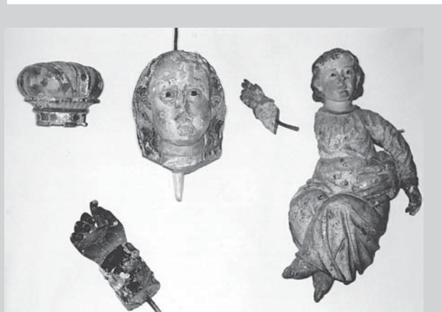
□ Slika 2. Sestavni deli močno poškodovanega kipa