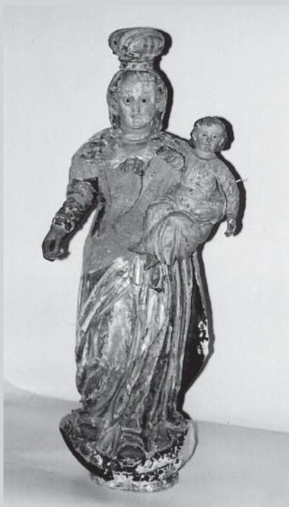
□ Slika 1. Baročni kip Marije z Jezusom pred restavriranjem

v dolgo haljo (slika 1). Jezus je v pol sedečem položaju in z desno roko blagoslavlja, levica pa mu sproščeno visi ob telesu. Sprednji vidni del je bil polihromiran. Hrbet je bil le na surovo zravnán, sredica ni bila izdolbena. Marija je bila oblečena v dolgo obleko in ogrnjena s plaščem, ki je na prsih spet s spono piramidaste oblike. Iz drže dlani desne roke in primerljivih upodobitev je bilo razvidno, da je držala rožni venec. Na Marijino glavo je bila nasajena krona. Sledovi žebeljev na Marijinem hrbtu kažejo, da so bili verjetno v ozadju žarki.