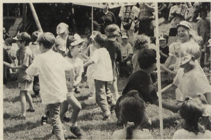
Veselo je bilo v vrtcu Slovenskega šolskega društva v Celovcu (SŠD)

da na tem planetu živi nešteto ljudi različnih narodnosti, barv in jezikov. V raznih igrah so na lahkoten način spoznavali posebnosti ter šege in navade drugih kulturnih krogov. Številne knjige, ki so bile otrokom na razpolago, so na slikovit način uprizarjale življenje drugih otrok in tako še dodatno popestrile vsakdan v vrtcu. Tako so na poletni veselici s pesmimi v raznih jezikih in s tujimi plesi dokazali, da glasba ne pozna nobenih meja.