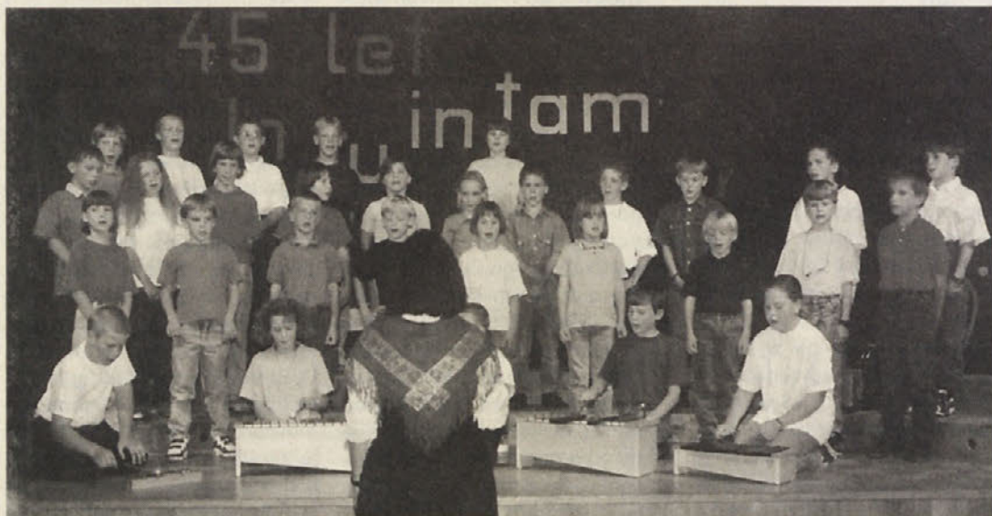
Selski šolarji – kmalu bojo peli v mešanem pevskem zboru