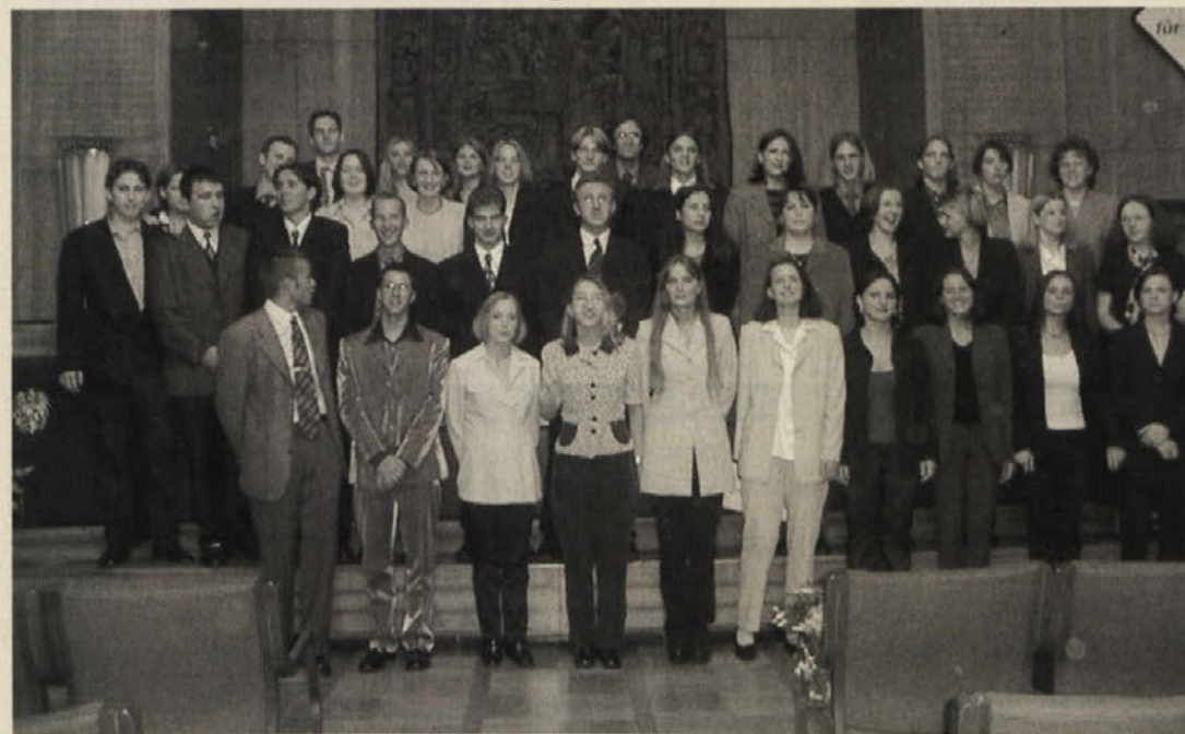
Na Dvojezični trgovski akademiji je letos maturiralo 34 dijakov