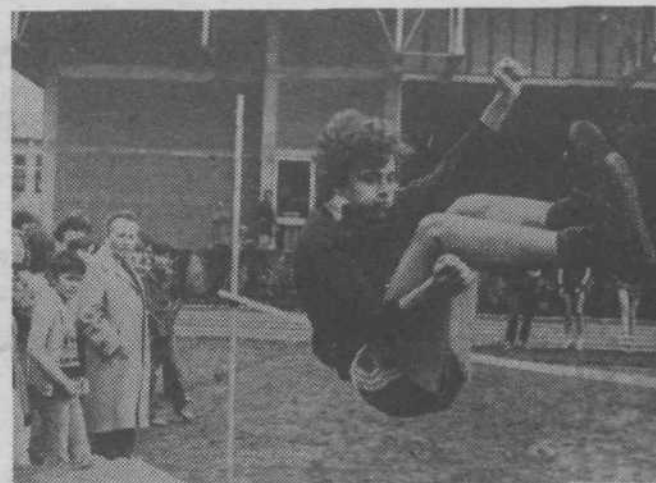
Mali atletski pokal