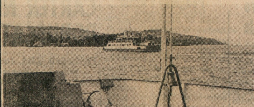
Srečanje z ladjo-brodom sredi Tihanijske ožine.