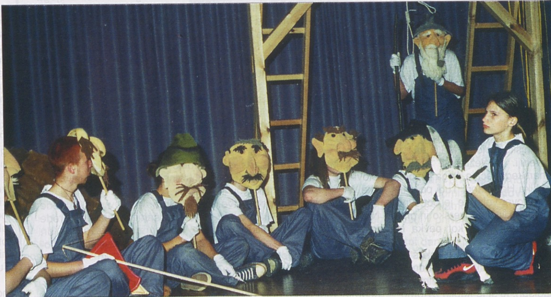
Slovenski zastopnik je bila lutkovna skupina KPD Šmihel

Povod za tovrstno gledališko srečanje je bil svetovni gledališki dan, ki je vsako leto 27. marca. Svetovni gledališki dan na žalost