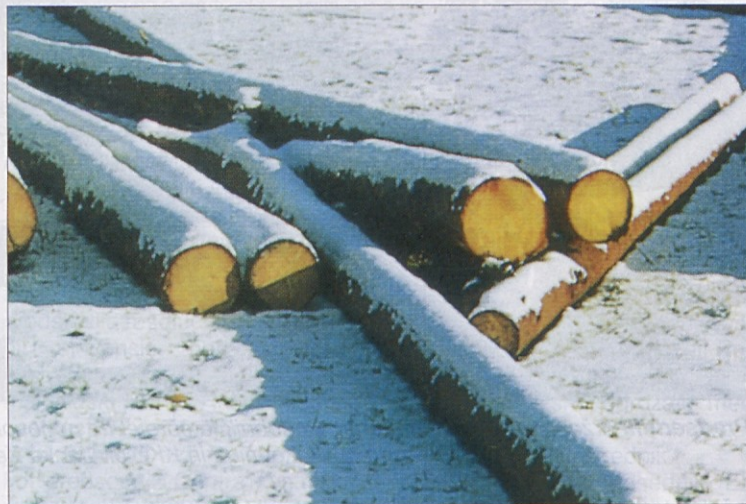
Les, ki je posekan pozimi in pri upoštevanju Luninih faz, je posebno odporen in ima, če ima znamko na hloodu, tudi boljšo ceno.

Zaradi tega odslej avstrijski gozdni kmetje ponujajo les, ki je bil posekan pozimi pod posebno zaščitno oznako „zimski les“ (Winterholz). Vsak hlood tega zimskega lesa ima posebno plaketo (v obliki božičnega kometa) in ima seveda tudi nekoliko boljšo ceno. Kupci se lahko pri zbornici informirajo, kje je takšen les na prodaj (tel. 0463/5850-283).