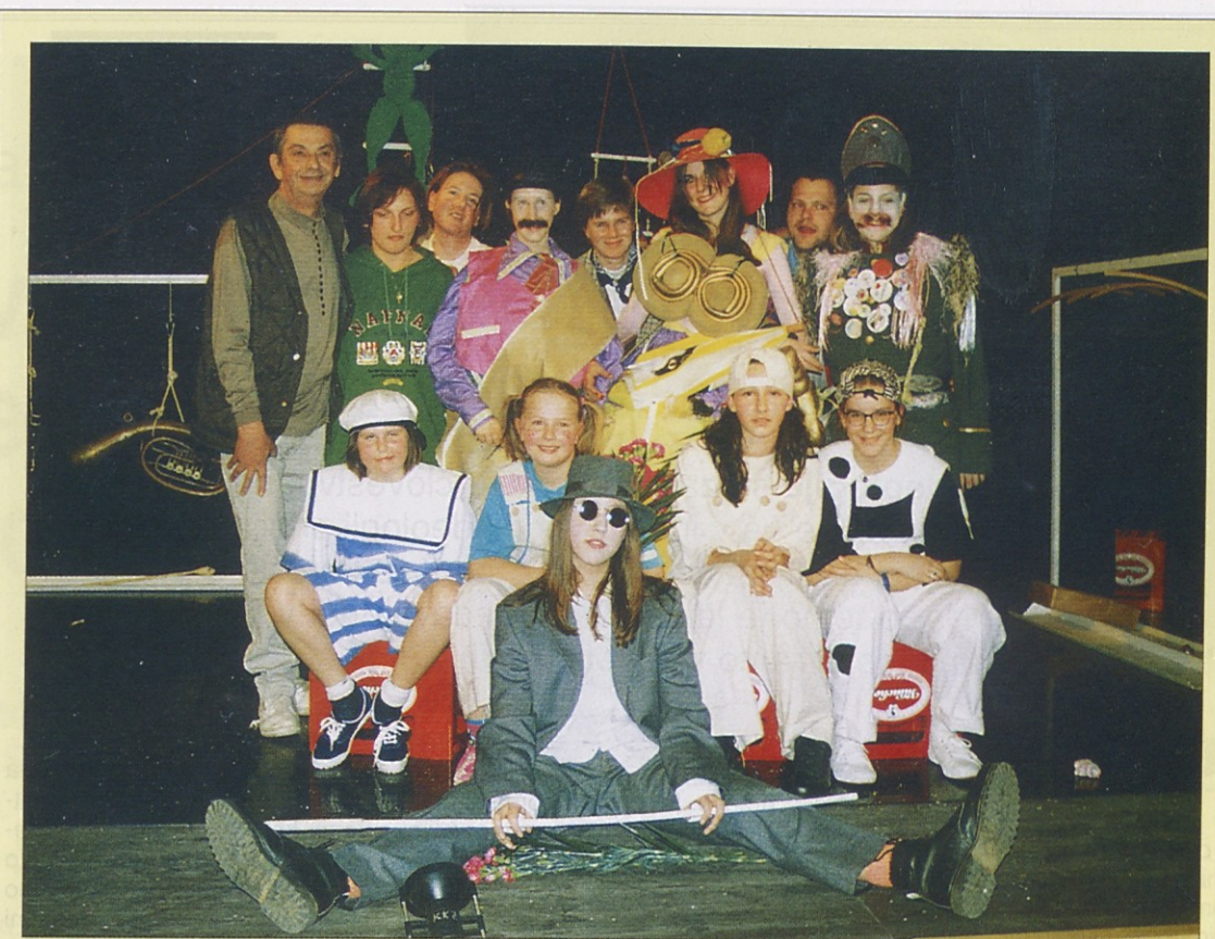
Otroška gledališka skupina je navdušila številno publiko.