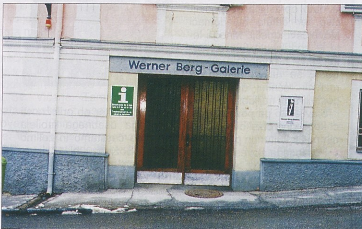
Galerijo Wernerja Berga obnavljajo in jo bodo 15. junija odprli.