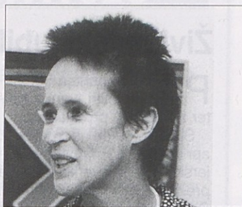
Umetnici Kiki Kogelnik želijo v Pliberku urediti stalni muzej.