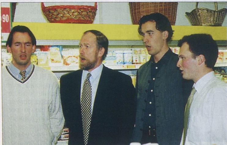
Na odprtje so prišli skoraj vsi bilčovski občani, ki večinoma štejejo k stalnim in zvestim kupcem domačega „lodna“.