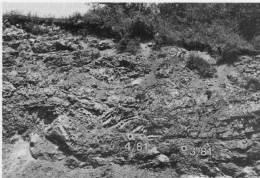
Abb. 2. Conodontenführende oberfassanische Plattenkalke im aufgelassenen Steinbruch an der Strasse Cajnarje-Lovranovo. Conodontenproben 3/81 und 4/81. Foto A. Ramovš

Sl. 2. Zgornjefassanski ploščasti apnenci s konodonti v opuščnem kamnolomu ob cesti Cajnarje-Lovranovo. Konodontna vzorca 3/81 in 4/81. Foto A. Ramovš