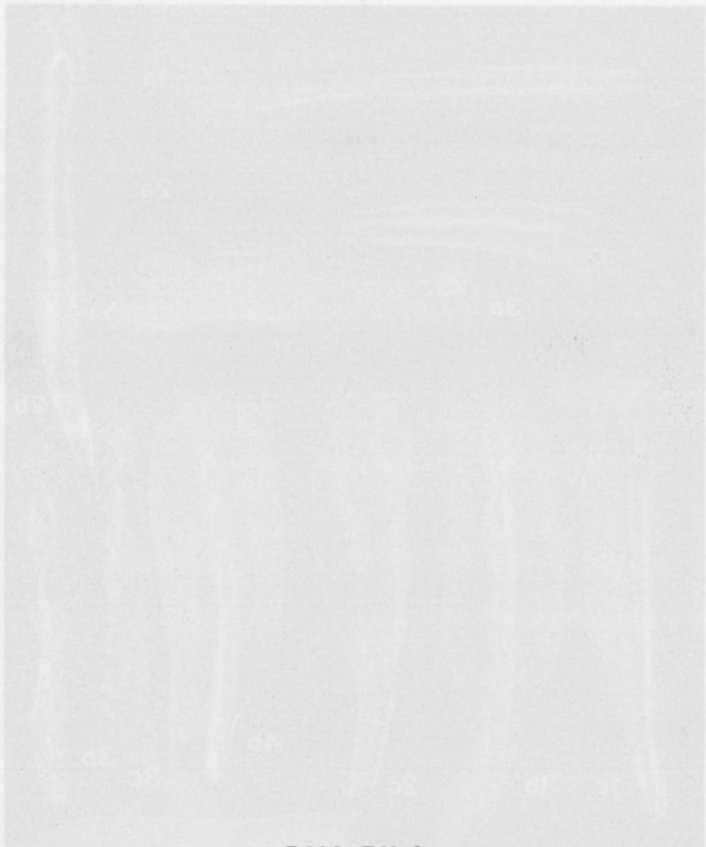
Tafel 2 - Tabla 2