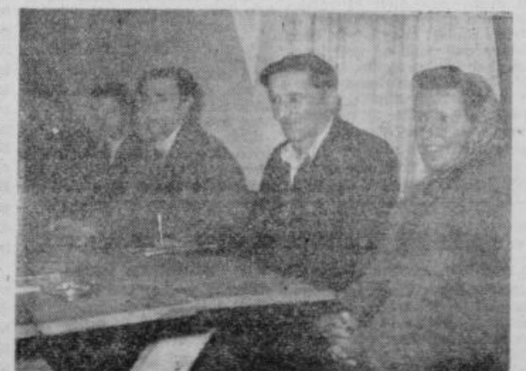
S tečaja o delavskem upravljanju v Domu ob Dravinji

»Napišite še nekaj o našem Silvestrovanju!« mi je v šali in menda zares rekla direktorjeva soproga ob slovesu, ko sem se vračal iz Stattenberga prepričan, da bo tam za Novo leto najlepše.