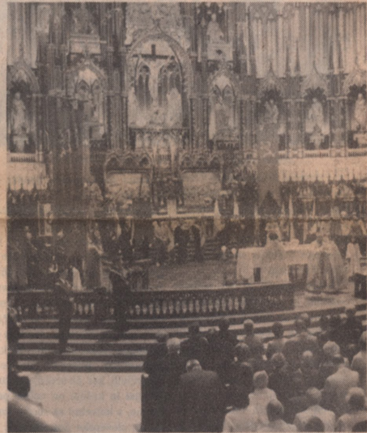
On the anniversary of the Bolshevik Revolution, the Young Canadians for a Christian Civilization along with many organizations of refugees had a Mass celebrated in Montreal (Oct. 19, 1980) for all the victims that Communism has made since 1917. The picture shows the high standards of the Young Canadians and the flags of the nations enslaved by Communism, in the historical Notre Dame Church, where the Mass was celebrated.