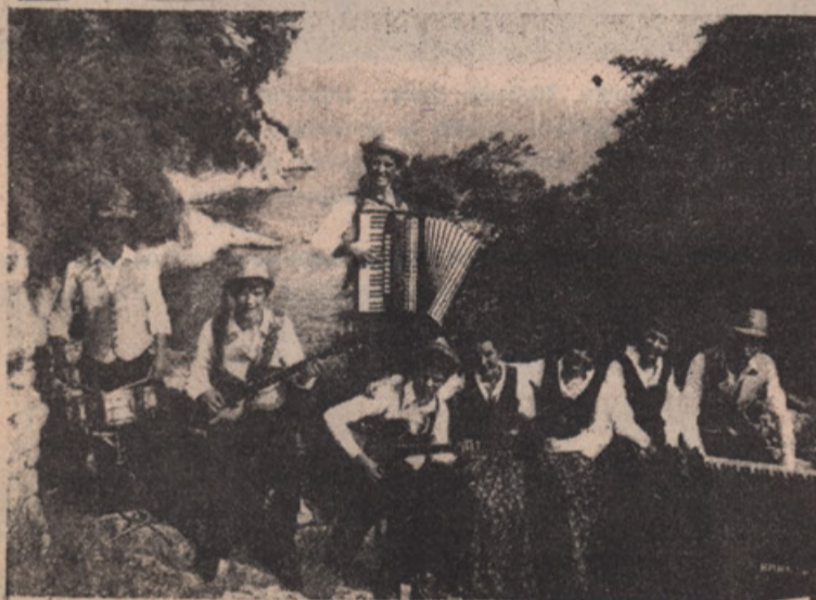
Ansambel "Galebi" in tercet "Mavrica".

• V dvorani Brezmadežne v New Torontu je bil 13. septembra letos bogat kulturni večer, — ko je gostoval ansambel "Galebi" in vokalni deklinski tercet "Mavrica". Prišli so iz Slovenskega Primorja!