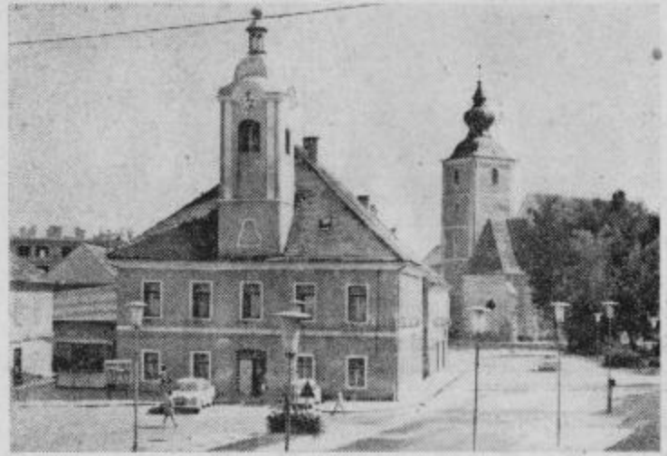
Prazna Slovenska Bistrica

Naš posnetek prikazuje Slovensko Bistrico okoli četrte ure popoldne, ko se v mesto zatečejo le redki, ki jih k temu prisiljuje kak nujen opravil.