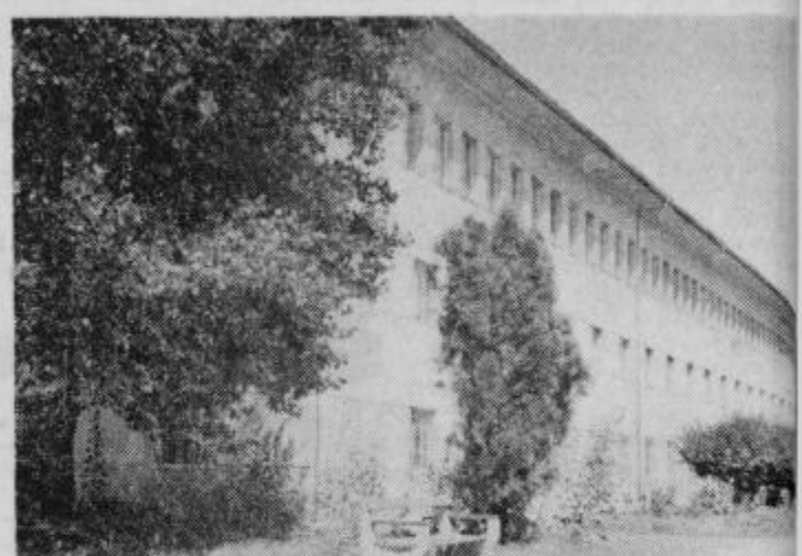
Pogled na dom »Dr. Jožeta Potrča«.

Ker je bilo precej očitko glede sestave jedilnika, ki je