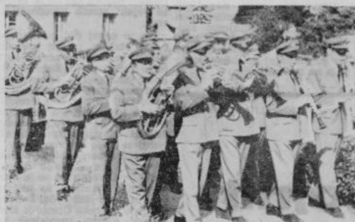
Ptujska godba na pihala spet nastopa

»Že v tem letu nameravamo prirediti več koncertov. Trenutno to ni mogoče vsled vročine in dopustov. V jeseni bomo pripravili koncerte verjetno kar na