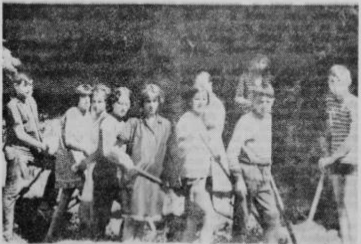
Mladi pomagajo urejevati mesto Ptuj

Ob tej svečanosti so podelili brigadirjem brigadirske značke. Ptujška krajevna skupnost se