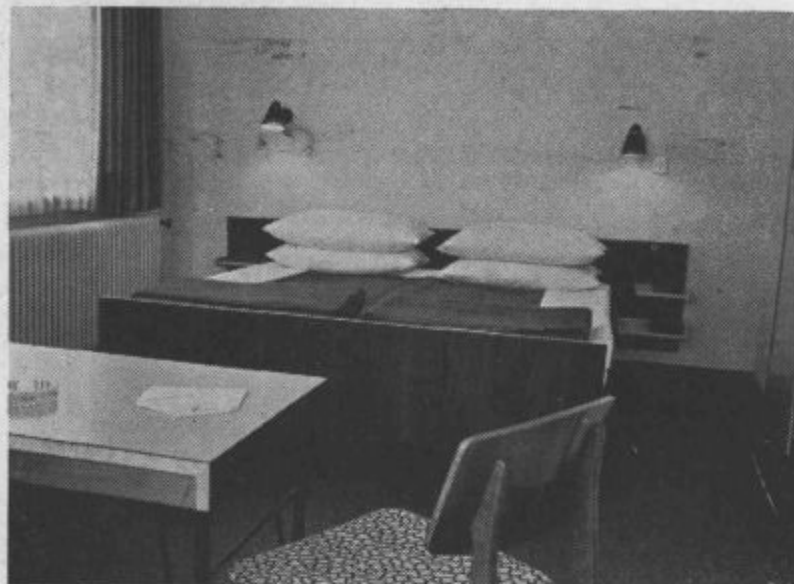
Lepo in sodobno opremljena soba v našem hotelu