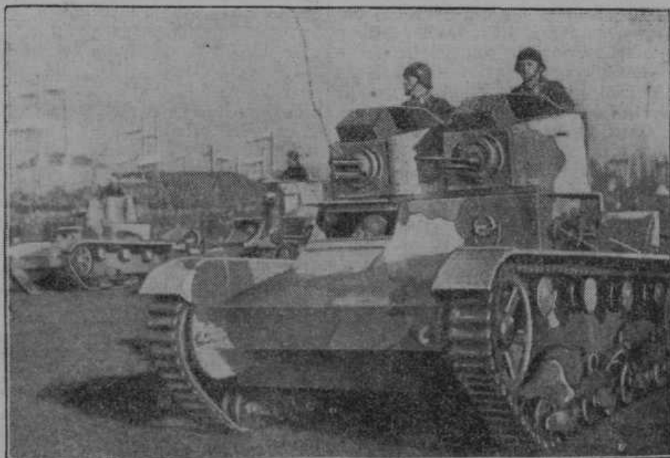
Parada tankov na Poljskem.

Triperesna vlomilska deteljica pred sodniki. Od 15. do 30. julija letos je bilo izvršeno v Kranju ter po okolici sedem vlomov, ki so vrgli vlomilcem skupno 12.130 Din. Vodja vlomilske tolpe je bil poklicni vlomilec Anton Anžur, ki je