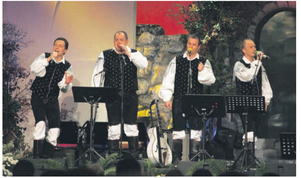
Modrijani so rekorderji po uvrstitvah na lestvici Celjskih 5, novembra so pripravili tudi imeniten koncert v Golovcu in praznovali 10 let delovanja.