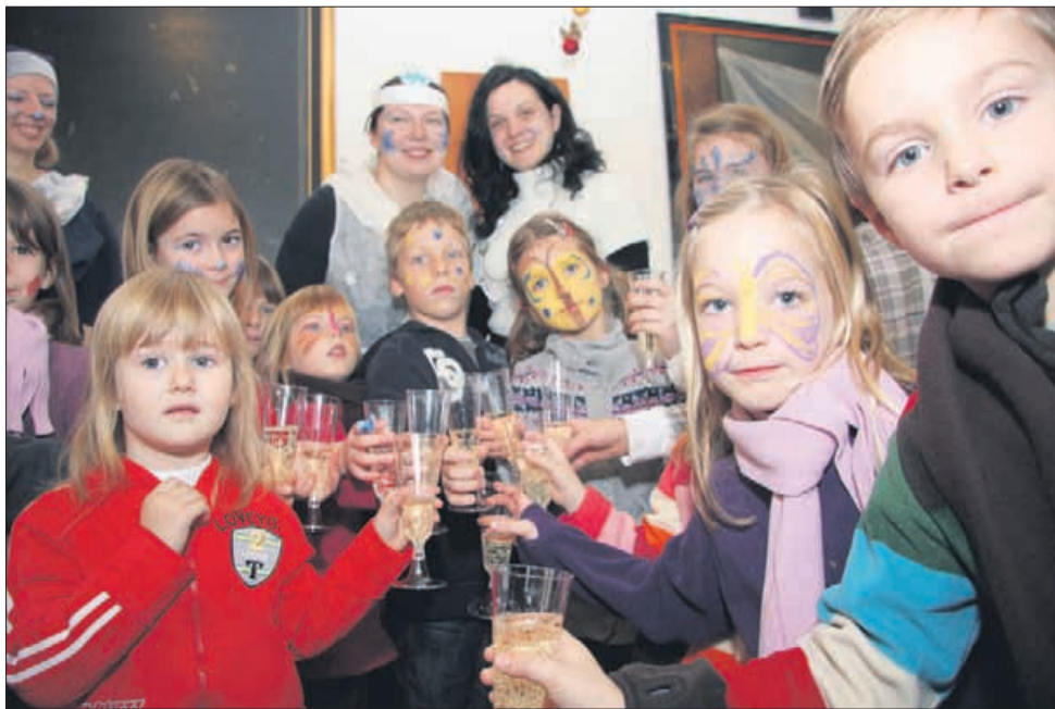
Tako so novemu letu nazdravili najmlajši.