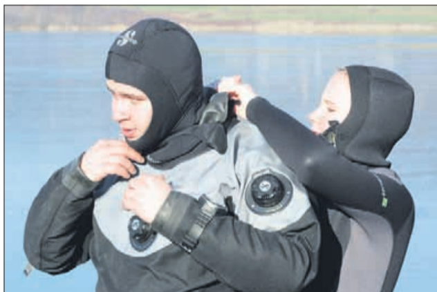
»Opremo še preveriva, potem pa bo!«