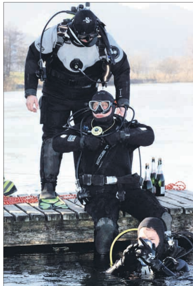
»No, pa gremo! Čakajte, nekdo naj vzame še penino!«