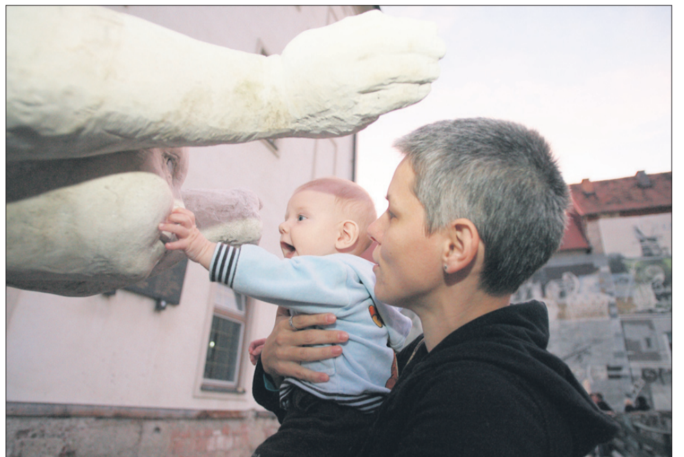
Razstava Kiparstvo danes je bila izjemen pregled dogajanj v tej veji vizualnih umetnosti.