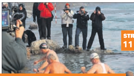
Osvežilna prvojanuarska kopel v Savinji