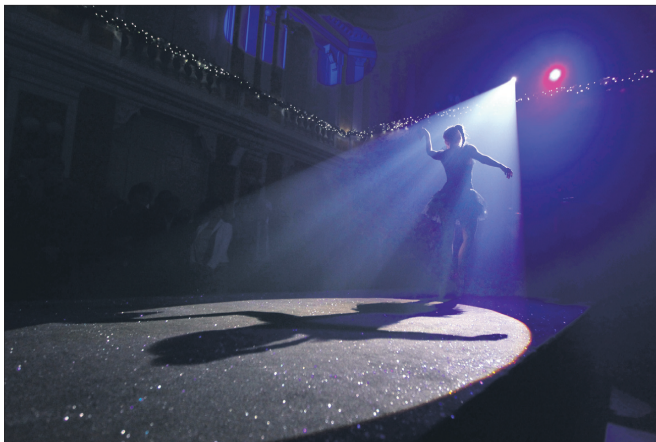
Plesalka Mojca v soju žarometov