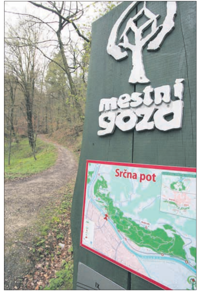
V program rehabilitacije srčnega bolnika je vselej vključena tudi ustrezna rekreacija. Pri tem je v Celju zelo dobrodošla Srčna pot nad Mestnim parkom.

Takšnega bolnika je mogoče v kratkem času oziroma v času, ki omogoča vzpostavitev normalnega pretoka skozi žilo, pripeljati v laboratorij za koronarografijo, kjer mu bodo opravili slikanje srčnih žil in opravili posege, s katerimi v velikem deležu tudi odpravijo zožitev in vstavijo opornico. Za takšnega bolnika, ki pride pravočasno na koronarografijo, je usoda popolnoma drugačna. Zaradi uspešnega posega bo v bolnišnici le par dni, vrnil se bo med domače in vključil v program rehabilitacije koronarnega kluba, kar mu bo omogočilo spremembo sloga življenja in spremenila se mu bo usoda. Praktično bo skoraj zdrav. Bolnik, ki pa tega ni deležen, bo postal invalid, odvisen od zdravil,