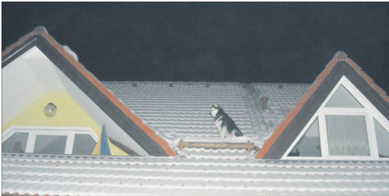
Navihana Kira je februarja takole ponosno nekaj časa sedela na strehi enonadstropne hiše na Ostrožnem. Dogodek si je v uredništvu črne kronike zaslužil posebno mesto, tudi zaradi tega, ker nam ves čas »očitajo«, da poročamo le o slabih stvareh. Črna kronika pač.