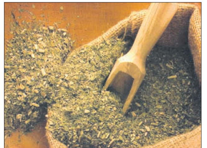
Mate čaj pospešuje presnovo

Raziskave, ki so jih opravili v zadnjih letih, so potrdile, da je zeleni čaj izjemno močen pospeševalec izgorevanja maščob. Med zelenimi čaji naj bi maščobo najbolj topil mate ( Ilex paraguariensis ). Kofein, ki ga vsebuje mate in zeleni čajni nasploh, pospešuje presnovo maščobnih kislin in je posledično v veliko pomoč pri hujšanju. Če se odpravljate v Argentino, Paragvaj, Urugvaj ali Brazilijo, je najbolje, da mate nabavite v deželah, kjer je doma. Vsi ostali pa ga lahko kupite tudi v čajnicah po večjih slovenskih mestih. Pripravimo ga navadno tako, da 1-2 žlički listov prelijemo s 150 ml vode, ki ima malce manj kot 100 stopinj Celzija in jih pustimo stati 3 minute, nato precedimo in pijemo.