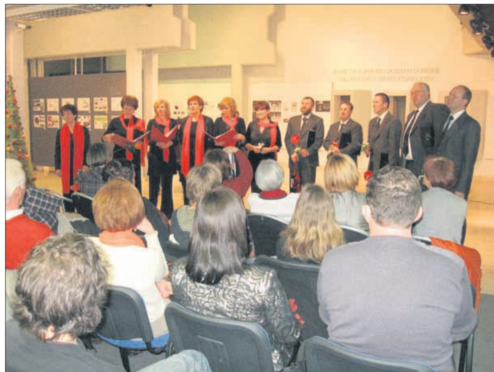
Natop seksteta Anima Vita in skupine Zven v velenjski Galeriji je navdušil številne obiskovalce.