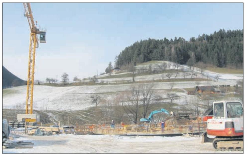
Gradnja Kulturnega središča evropskih vesoljskih tehnologij v Vitanju