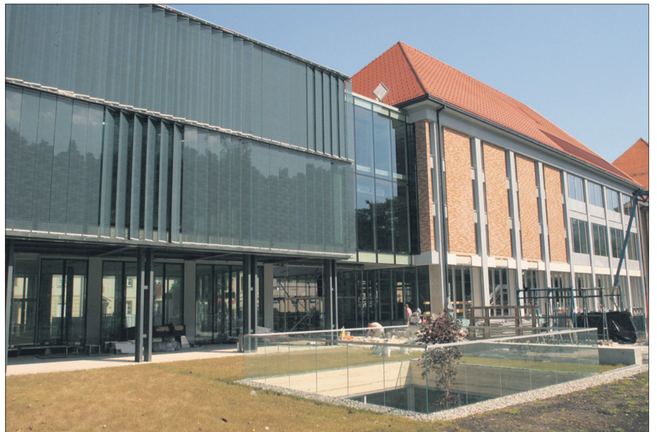
Največja kulturna pridobitev mesta in regije – nova Osrednja knjižnica Celje

bomo pripravljali tudi svoje in jih ponujali drugim. To je zama, ki ga kultura v poplavi prireditev nujno rabi.