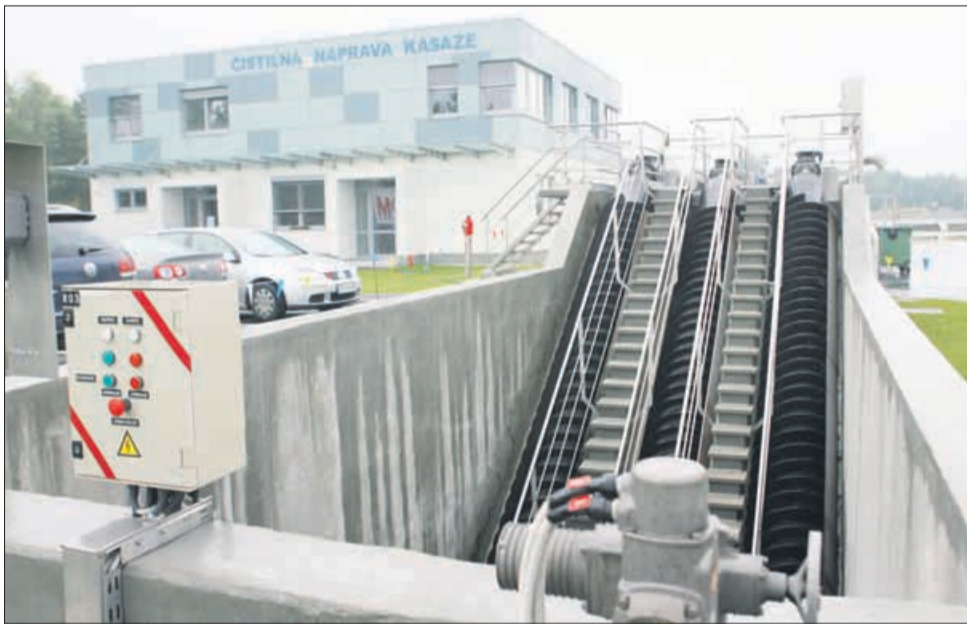
Čistilna naprava v Kasazah je že nekaj časa zgrajena, kanalizacija pa še vedno ne.