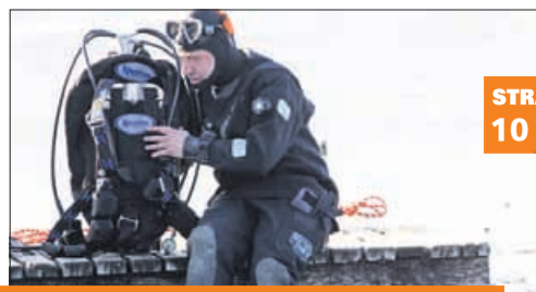
Ledeni novoletni potop v Velenjsko jezero