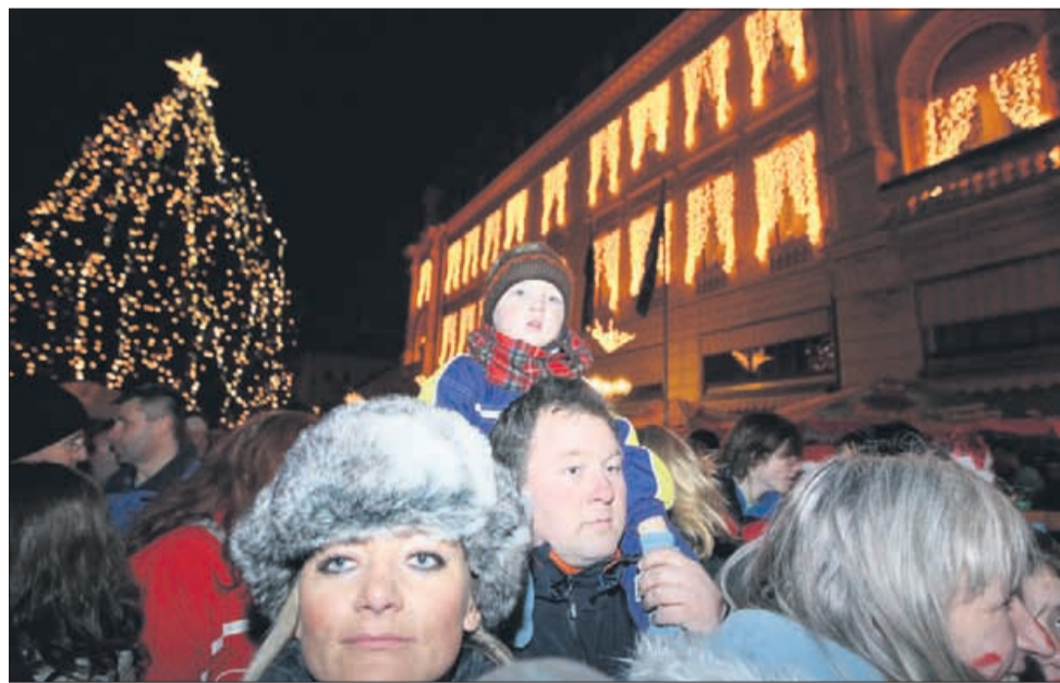
Na Trgu celjskih knezov se je zabavalo mlado in staro.