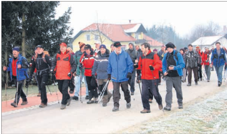
Pohodniki na Bezovec

Novoletni pohod, ki ga je pripravilo Planinsko društvo Dobrovlje - Braslovče, je bil 22. po vrsti, pot pa je pohodnike tudi tokrat vodila na