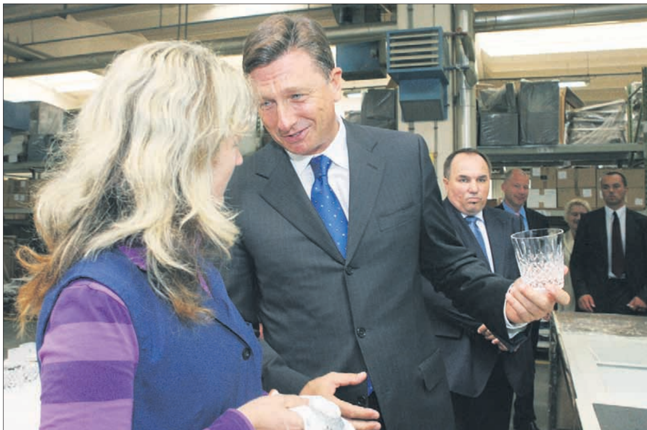
Predsednik vlade Borut Pahor med obiskom v Steklarni Rogaška