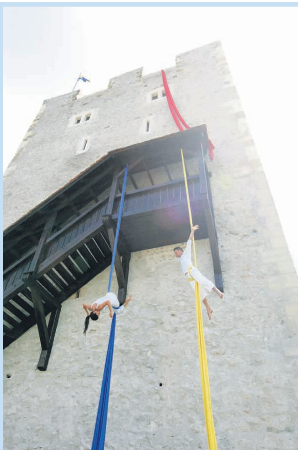
S sanacijo Friderikovega stolpa je celjski Stari gradu zasijal v novi in lepši podobi.