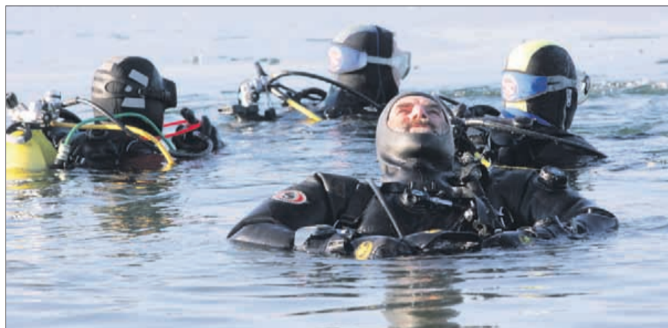
»Tole pa »paše! Sonček sije, voda ima prijetnih 5 stopinj ... Kot nalašč za hrbtno plavanje!«