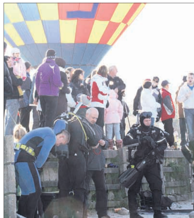
Nekateri so potop raje spremljali kar z varne lokacije, torej z brega. V toplih bundah, se razume.