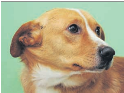
Kratkodlaki svetlo rjavi mešanček je star 15 mesecev. Je majhne rasti, sicer pa prijazen in živahen ter poln energije, primeren tudi za stanovanje. (Koko)