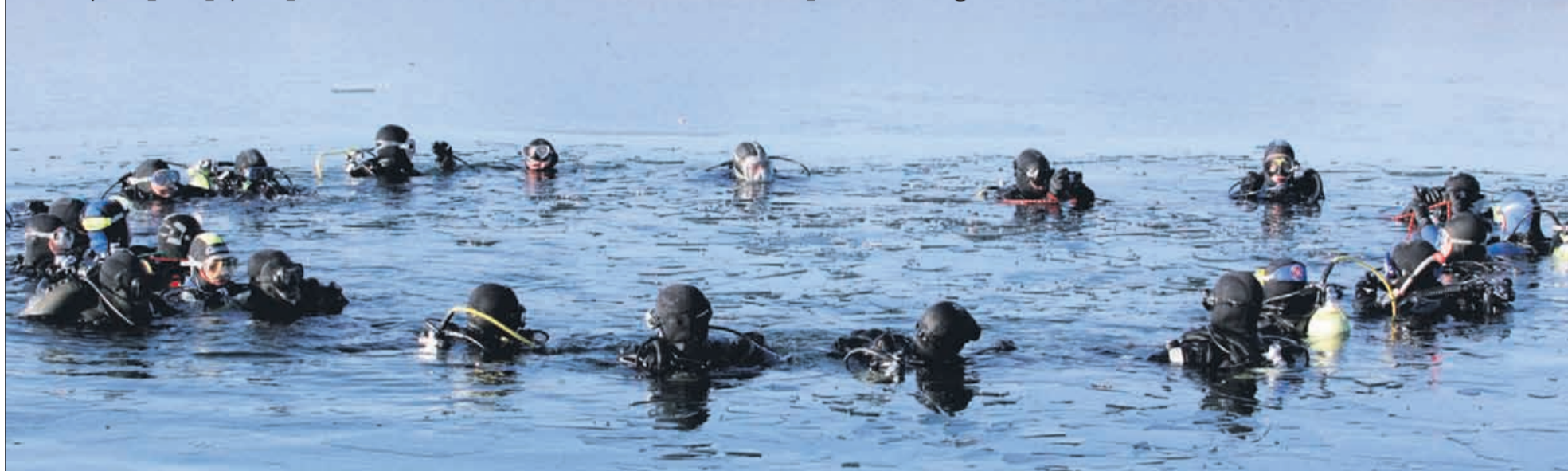
Na zdravje letu 2011 v Velenjskem jezeru!

Velenjski potapljači prvemu dnevu v letu 2011 »nazdravili« pod vodno gladino