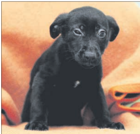
Plaha samička mešanica, z dlako srednje dolžine, stara 2 meseca in pol, išče novega lastnika. Našli so jo v Celju. (Luna)