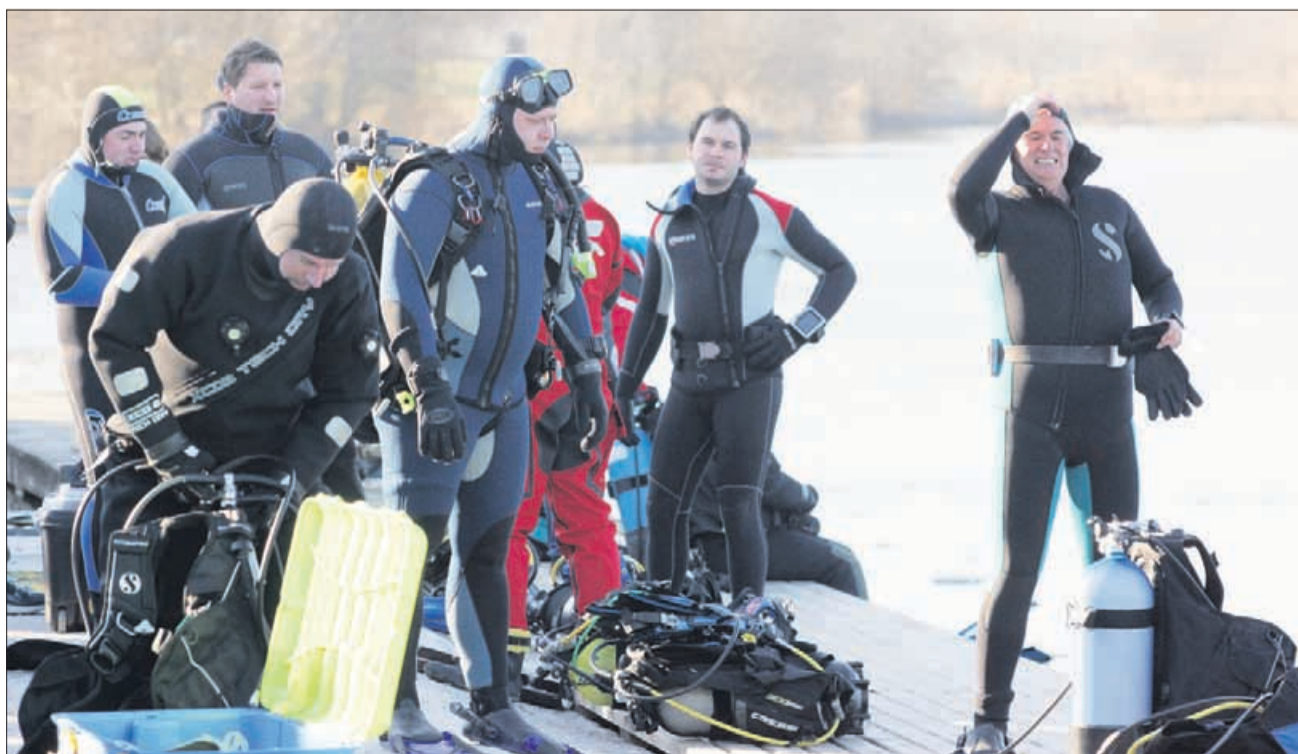
»Eh, fantje, saj ni mrzlo. Samo videti je tako!«