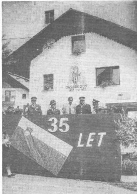
no brigadlo, leta 1962 nov gasilski dom (tudi tega so seveda zgradili udarniško), leta 1973 so kupili prvi avto, v zadnjih letih pa so adaptirali in posodobili svoj prenovljeni gasilski dom...