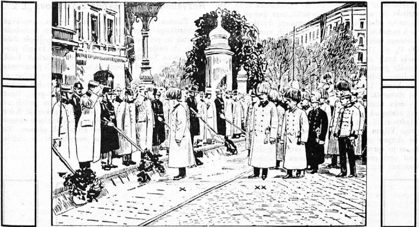
Cesar Franc Jožef x in prestolonaslednik xx pri slavnosti stoletnice bitke pri Lipskem na Dunaju.