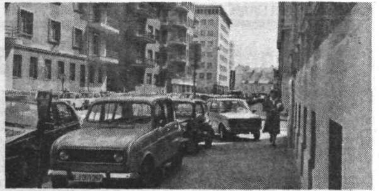
Problem mirujočega prometa zahteva takojšnje rešitev. Svet KS Ajdovščina opozarja že več let zapored, da je treba določiti še dopustno število parkirnih mest, ki jih ta ekološko ogroženi predel mesta sploh lahko sprejme. V mestnem središču je treba dosledno zmanjševati število parkirnih mest in sploh promet motornih vozil. Predvidena gradnja garažnih hiš v gostu poseljenem središču mesta je povsem v nesprotju s temi prizadevanji. Parkirišča naj bodo zunaj ožjega mestnega obroča in zagotoviti moramo ustrezno prometno ureditev.