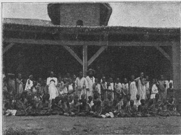
Obisk zamorcev na misijonski postaji.