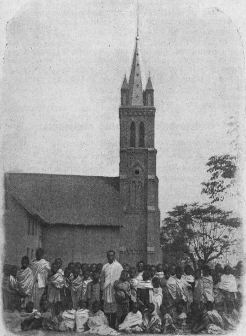
Skupina dečkov in cerkev v Betafo.