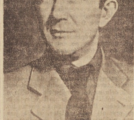
Naš delegat — Milovan Djilas

O teh napadalnih sredstvih je Djilas pogumno govoril. V svojem govoru je omenil šest takih oblik pritiska na našo državo: politični, gospodarski in vojaški pritisk,