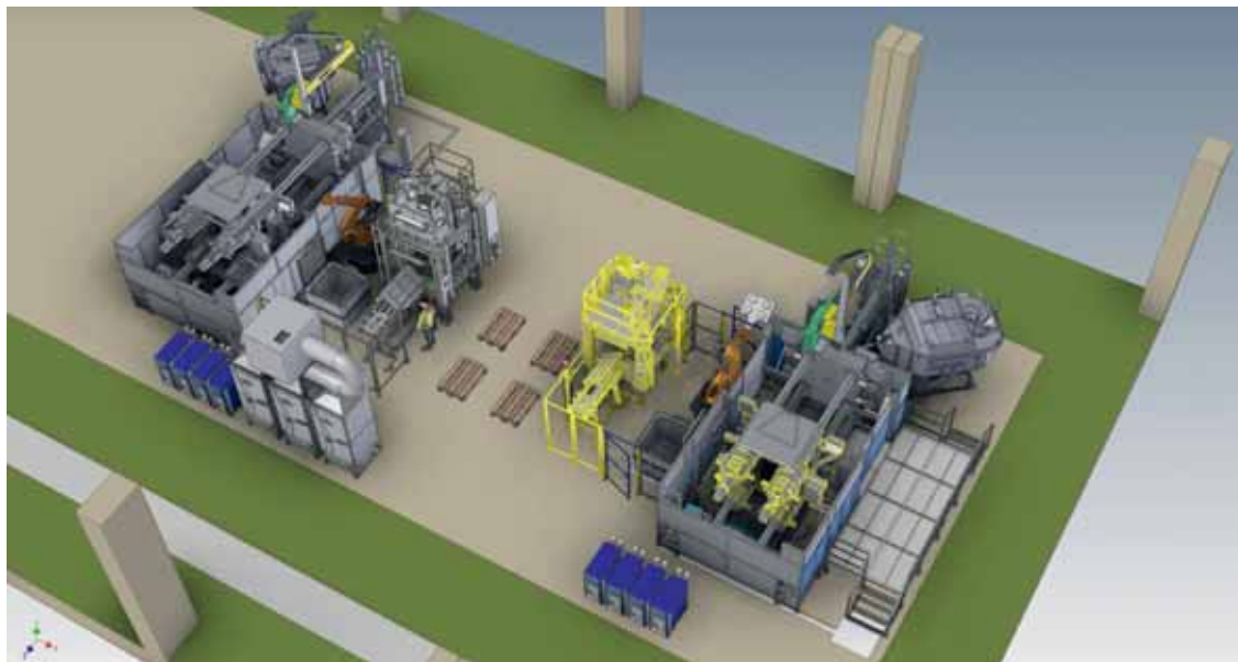
Postavitev dveh livnih celic Bühler s pripadajočo opremo

Vzporedno z razvojem livarne ulitkov vlagamo tudi v razvoj lastne orodjarne , v kateri želimo vzpostaviti potrebno opremo in znanja za izdelavo izjemno zahtevnih kokilnih orodij. Lastna orodjarna bo pomemben podporni steber in ena ključnih kompetenc za vzpostavitev uspešne lastne proizvodnje ulitkov, istočasno pa predsta-