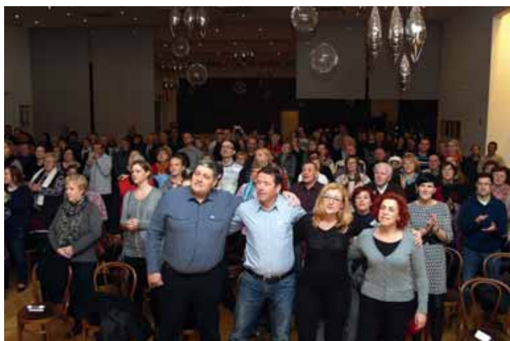
Dobro razpoloženi poslušalci