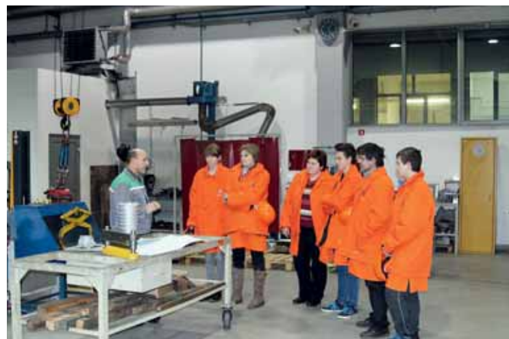
Učenci v spremstvu staršev na obisku v orodjarni

Na tem mestu že danes vabimo mlade, ki se odločajo o nadaljnjem šolanju, in njihove starše na že 5. Dan praktičnega prikaza poklicev, ki ga bomo v Talumu organizirali 23. januarja 2016. □