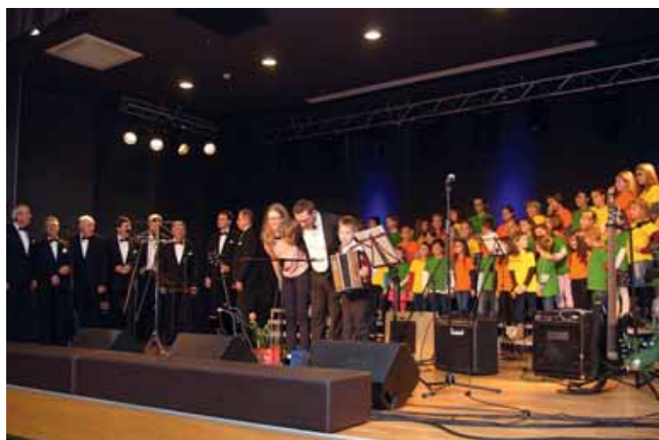
Uspešen konec prireditve

December, mesec, ko se ozremo nazaj in pričakujemo prihod novega leta, je kot nalašč primeren, da se našim poslušalcem predstavimo s svojimi dosežki. Da pa to ne bi izzvenelo preveč monotono, smo medse povabili zanimive glasbene goste. Nedeljsko popoldne smo začeli še z zadnjimi pripravami in uglaševanjem vseh nastopajočih, ob 17. uri pa so naši poslušalci napolnili dvorano.