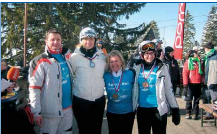
Nagrajene članice z županom