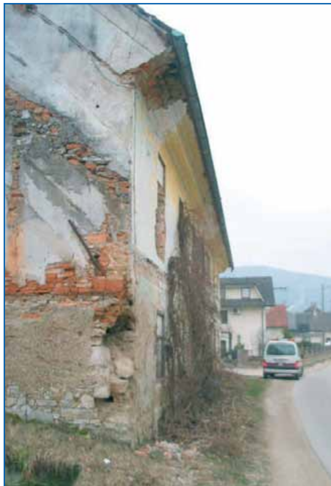
Občina je dala na seznam kar nekaj nevarnih stavb.