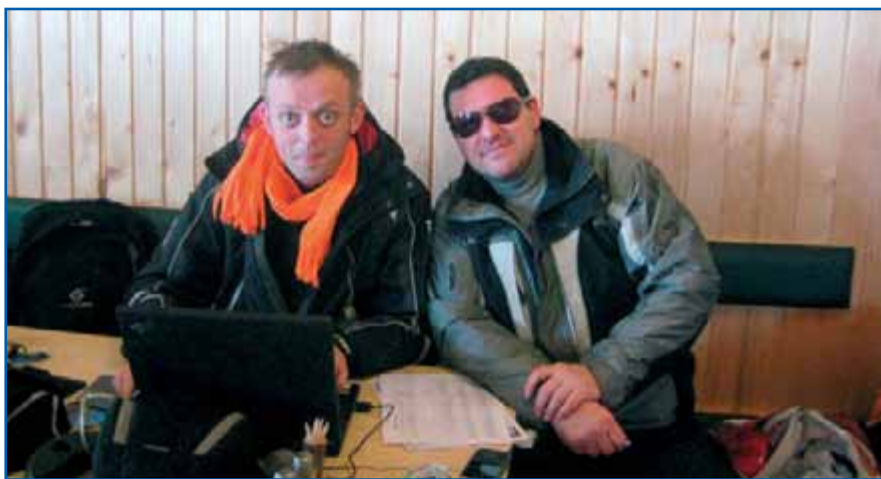
Takole so budno spremljali rezultate.