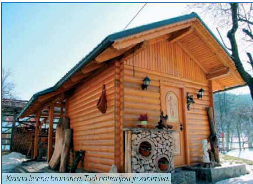
Krasna lesena brunarica. Tudi notranjost je zanimiva.