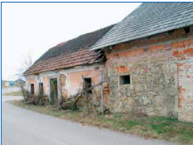
Tik ob cesti-nevarno za mimoidoče.