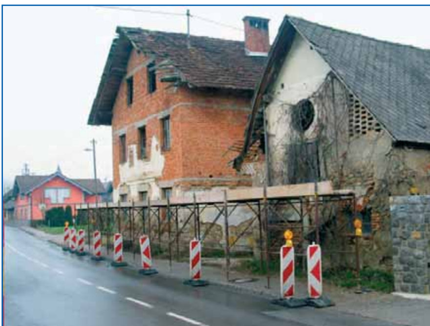
Lokacija v Zapogah, zdaj že sanirano.