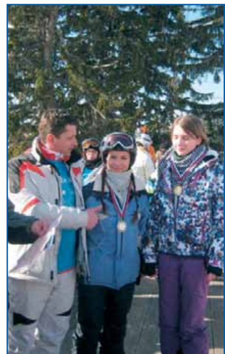
Tudi dekleta so bila odlična.