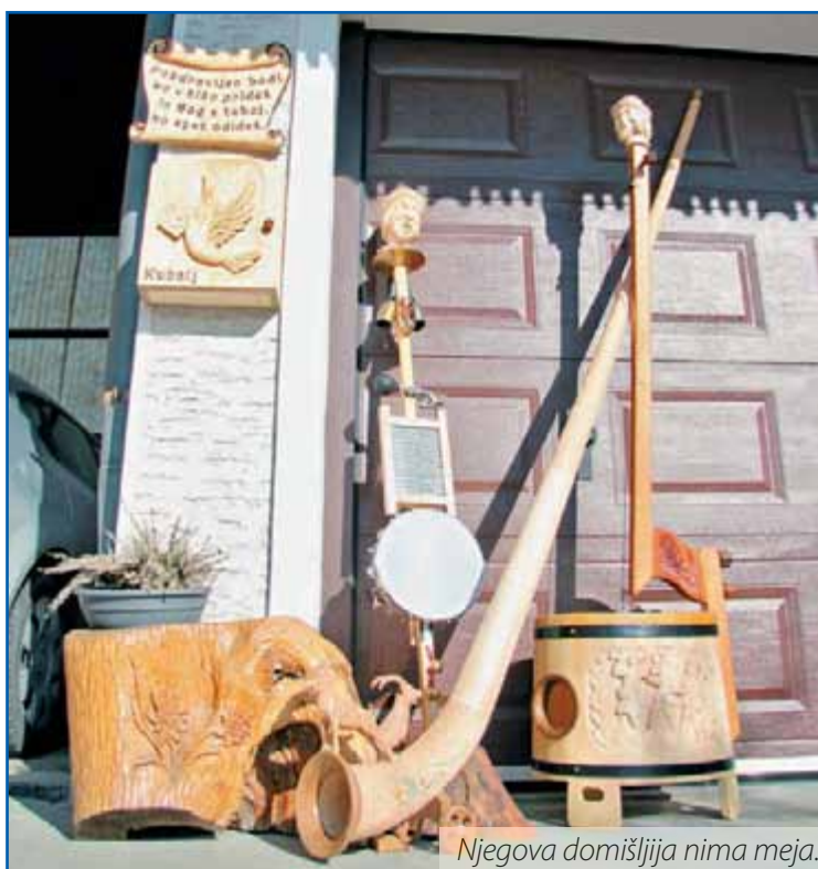
Njegova domišljija nima meja.