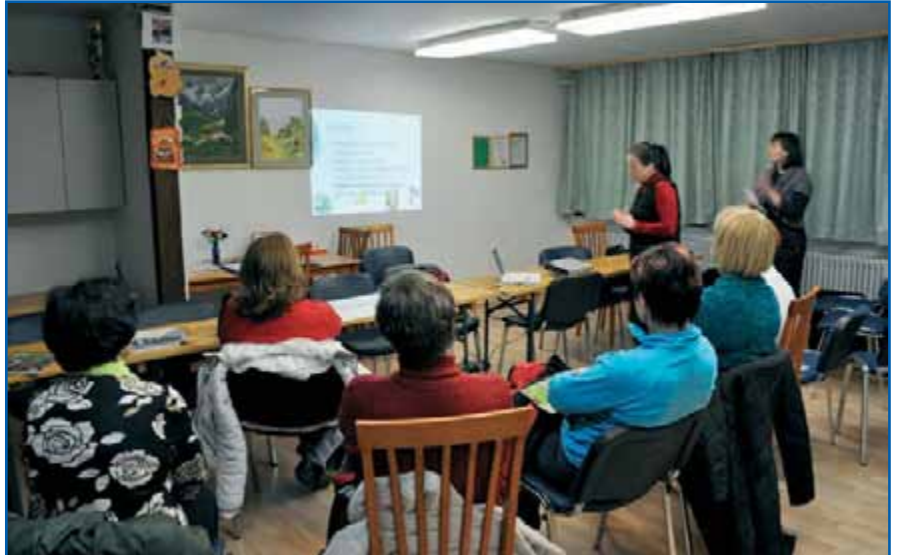
Na predavanju o kemikalijah.

Kemikalije so namreč skoraj v vsakem izdelku, ki ga uporabljamo – tako niti kozmetika, čistila, oblačila, hrana, pijača in tudi igrače niso varni pred njimi. Predavateljica je povedala, da so kemikalije, ki jih nanašamo na kožo, celo bolj nevarne kot tiste, ki jih zaužijemo. Treba se je zavedati, da naravne kozmetike ni, tista, ki jo naredimo doma, in je naravna, se pokvari v dnevu ali dveh. Pri izdelkih, ki jih imamo za ekološke, je še vedno treba pogledati sestavine, saj je dovolj že pet odstotkov naravnih sestavin v izdelku, da dobi naziv ekološko in naravno. Prisotne je najbolj presenetila izjava, da so najbolj strupene snovi ravno iz narave. Narava je namreč ustvarila največ in najbolj nevarne strupe. Strupe sicer uživamo dnevno s čaji, pa se tega niti ne zavedamo, saj je količina zaužitega strupa majhna. Umetni strup, ki ga imamo za naj-