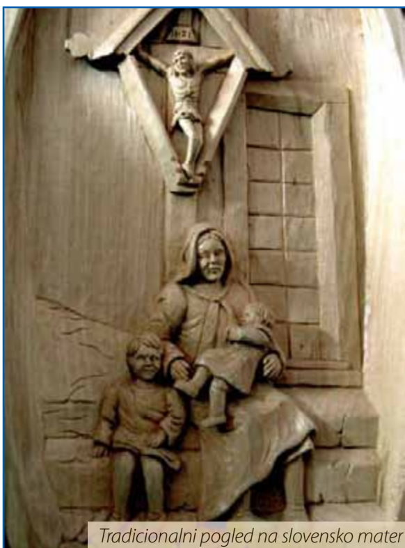
Tradicionalni pogled na slovensko mater