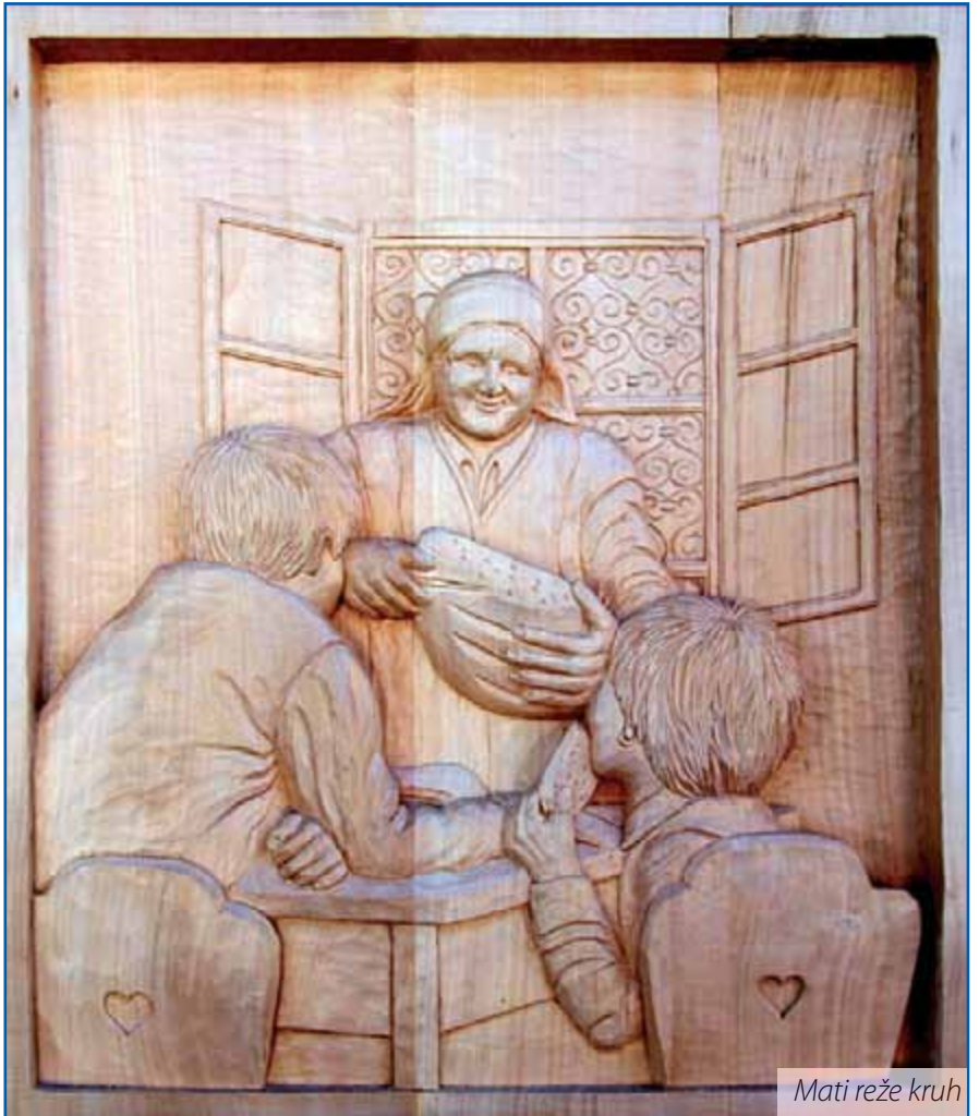
Mati reže kruh