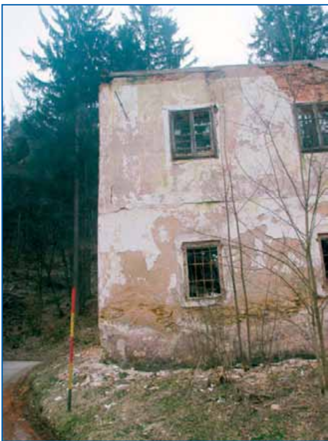
Lokacija Šinkov Turn