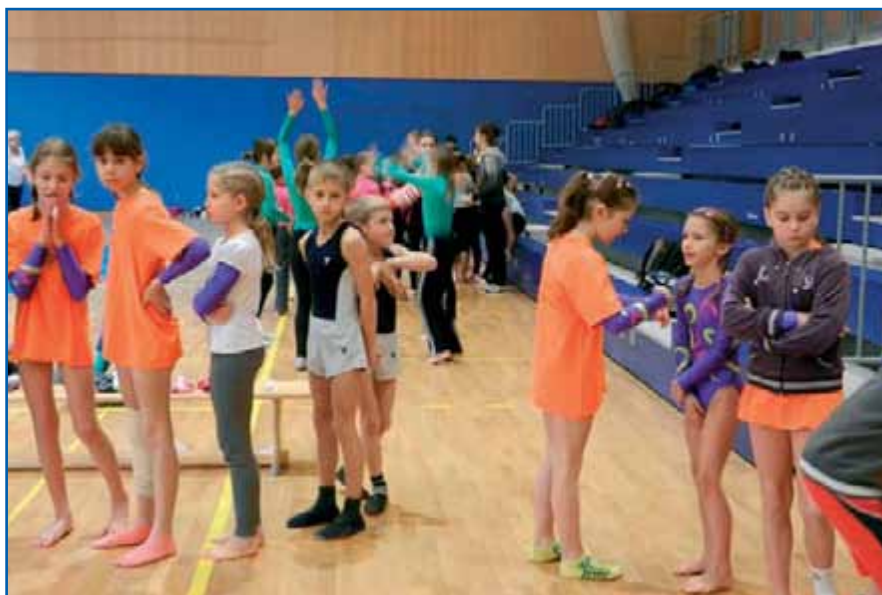
Polfinale DP v skokih na MPP