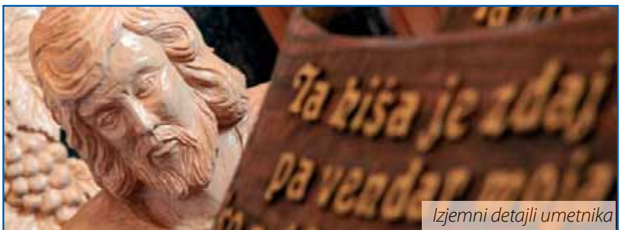
Izjemni detajli umetnika