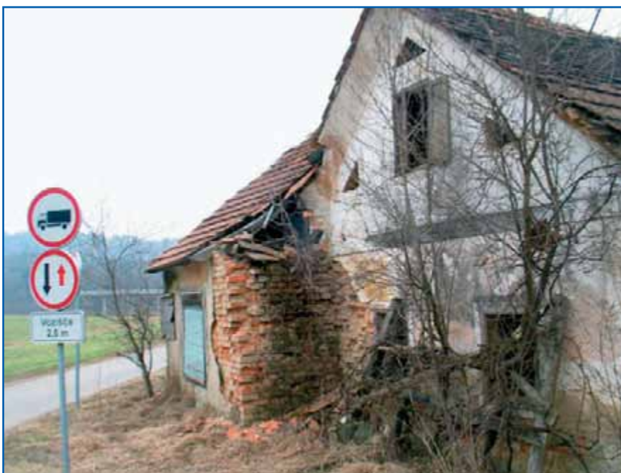
Opuščene hiše so lahko nevarne.