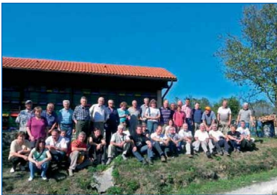
Lep spomin na izlet

Pot nas je vodila naprej po Brkinih in ustavili smo se v prijetni vasi Prem, ki je rojstna vas pesnika Dragotina Ketteja. V nekdanji ljudski šoli je urejena pesnikova spominska soba, poleg te pa je na ogled tudi črna kuhinja. Z vrha griča, kjer stoji premski grad, je čudovit pogled na bližnjo in daljno okolico, saj lahko v jasnem vremenu od tu vidimo hribovje Snežnika, Nanosa, Kozleka, Šilen-