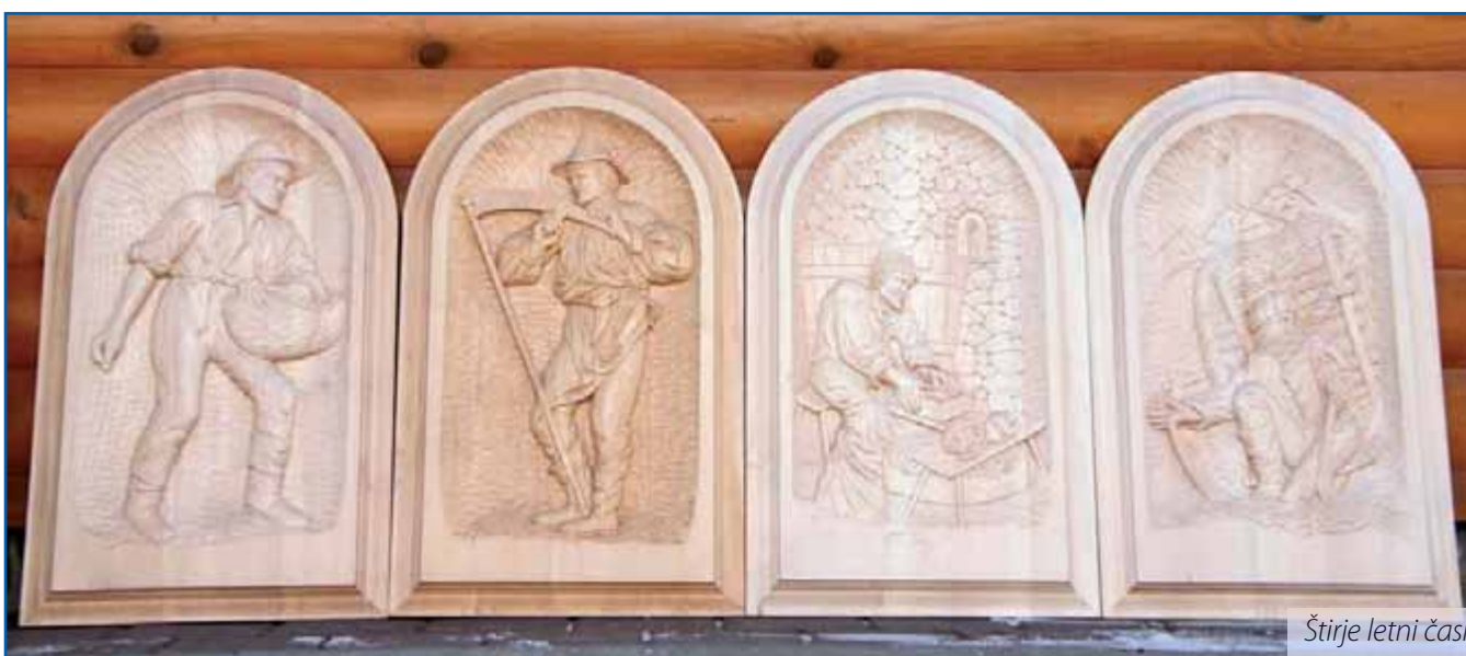
Štirje letni časi