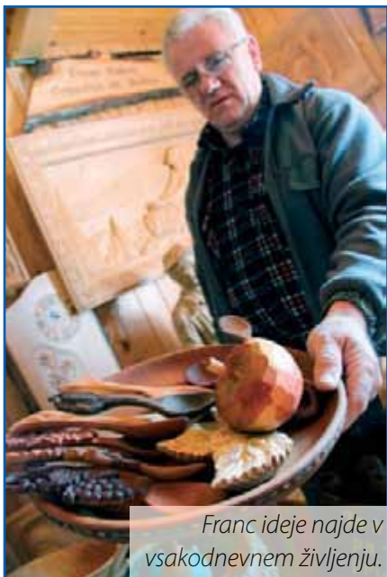
Franc ideje najde v vsakodnevem življenju.