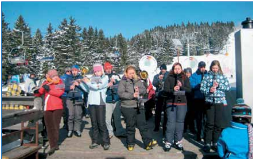
Razigrana vodiška godba