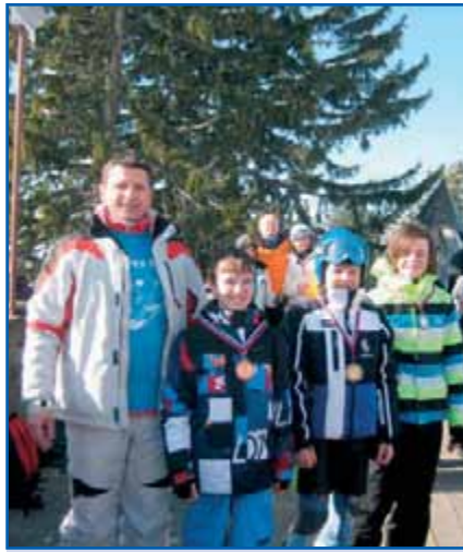
Najboljši trije v kategoriji dečki