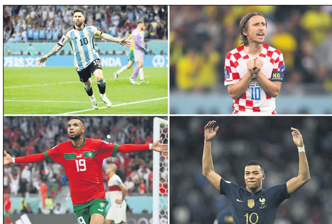
Vodje svojih reprezentanc – polfinalistov svetovnega prvenstva Katar 2022

»Ognjenik«, kot jih radi imenujejo v njihovi domovini, so se že drugič zaporedno uvrstili med štiri najboljše ekipe na svetu, kar ne more biti naključje. Stokovno delo in predanost državnemu dresu so glavne vrline Daličevih varovancev. Na Hrvaškem imajo izredno nogometno šolo in non-stop proizvajajo odlične mlade igralce. Odlično izbrana mešanica mladih in starih igralcev, hierarhija in spoštovanje v sami ekipi in predvsem odnos do igre so glavne značilnosti ene najuspešnejših nogometnih formul v zadnjem obdobju in krasijo hrvaški model nogometa. Če k temu dodamo še Modriča, ki ni samo eden najboljših nogometašev na svetu, ampak tudi izjemen človek, je slika popolna. Ko drugi plešejo in se veselijo, se Hrvati enostavno čudežno borijo. Zato si zaslužijo aplavz na odprti sceni.