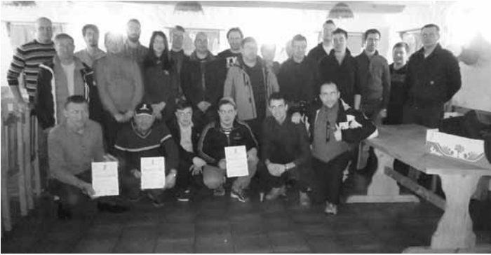
Športno društvo Destrnik

Februarja je bil sklican občni zbor Športnega društva Destrnik, na katerem so pregledali delo in uspehe za lansko leto ter začrtali cilje za tekoče.