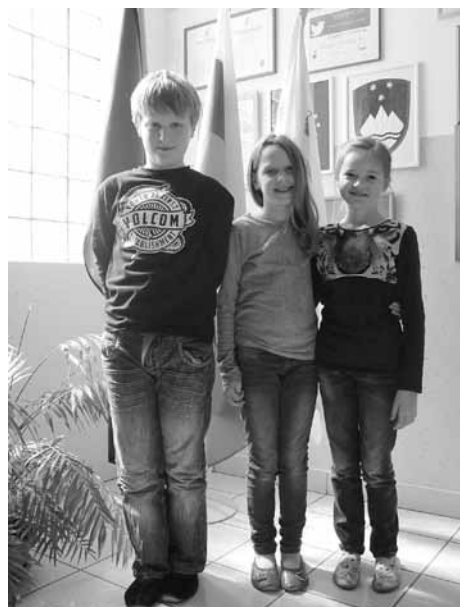
OŠ Destrnik - Trnovska vas

Vabilu so se odzvali tudi učenci OŠ Destrnik-Trnovska vas in dosegli odmevne rezultate.