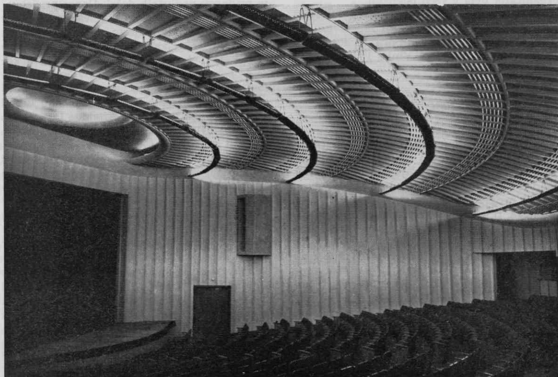
Gledališka dvorana

V vseh letih gradnje, tj. od leta 1953 do otvoritve 29. novembra 1956, je bilo pri gradnji doma poprečno zaposlenih 68 delavcev raznih strok, opravljenih je bilo ca. 80.000 delavnikov, 34.000 prostovoljnih delovnih ur, bilo je 36 lažjih nesreč pri delu, izkopane zemlje je bilo skupno 8596 m 3 , vsa dela pa