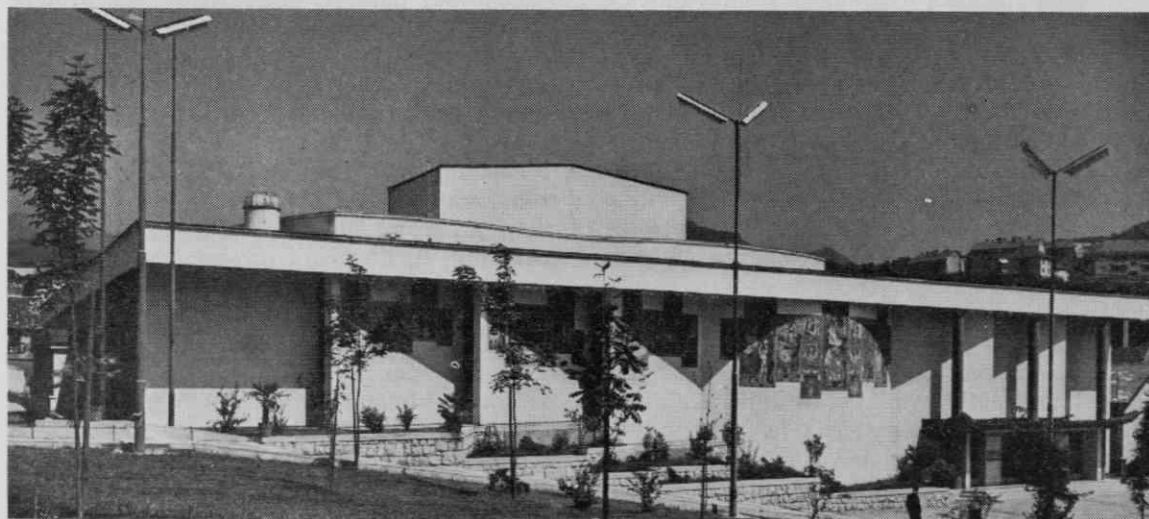
Pročelje Delavskega doma

Vsaka od večjih dvoran ima svojo lupino, na kateri leži krovna nosilna konstrukcija.