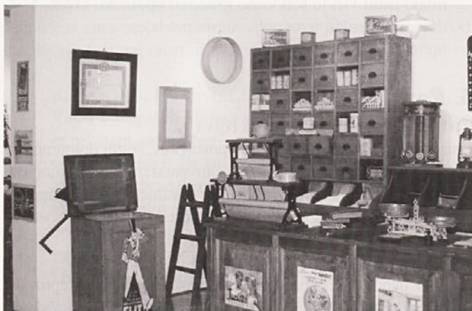
Razstavljen eksponat na razstavi Razvoj trgovine v Zasavju.