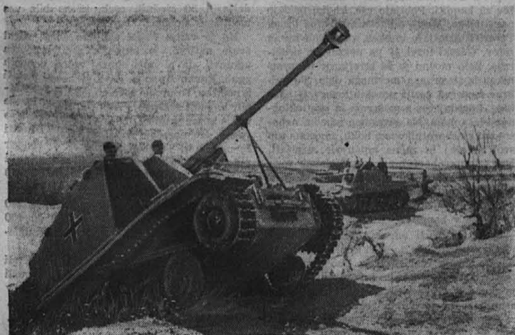
Na vzhodni fronti v prostoru pri Orlu

V Neaplju je bilo porušenih ali hudo poškodovanih po angleško-severnoameriških zračnih gusarjih: 21 cerkva, 1 muzej, 10 šol, 1 športni prostor, ženska kaznilnica, 7 otroških vrtec, 1 otroški dom, mestni arhiv iz dobe Burbonov, 16 zgodovinskih palač in dva parka.