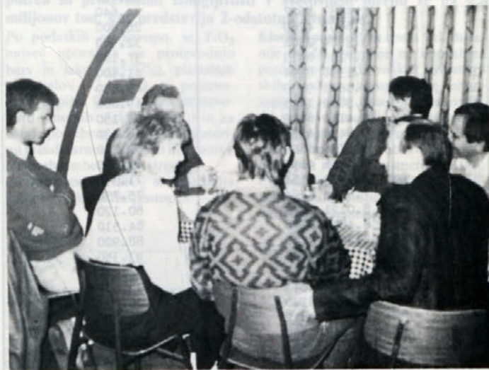
Takole se sklepajo posli v Domu železarjev

Organizacija je bila tako v poslovnem kot kulturnem smislu na visoki ravni, saj to le malokdo organizira. Žal pa se je po mojem mnenju poslovnih dnevov udeležilo premalo kupcev z Makedonije, Črne Gore in Kosova. Prodaja na mojem področju zaradi nizke kupne moči delovnih organizacij količinsko malo upada, zato menim, da bi se morali bolj prilagajati terenu.