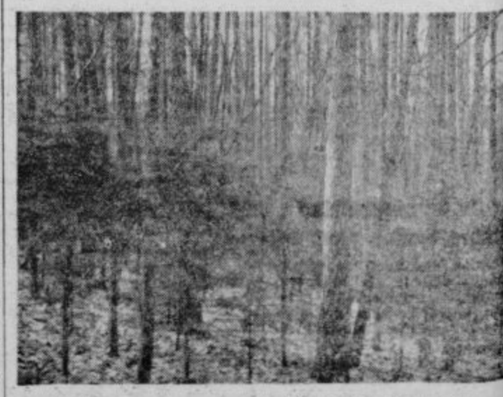
Motiv iz gozda na območju GG Maribor, obrat Ptuj

komisija v I. razred, so dobili s tem »dovolilnico« za uporabo v osemenjevanju. Med njimi so nekateri, ki bodo v prihodnjem letu, ko bo več znanega o kvaliteti njihovega zaroda, prišli v I. razred. Takšen med njimi je prav gotovo bik Goran R-151, ki je s 4 in pol leta dosegel 1200 kg. V II. razredu pa so mlajši biki, stari v povprečju okoli 3 leta, ki