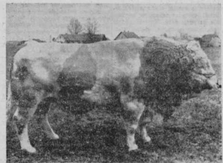
Bik KARO R-60, rojen 1. julija 1955. Kljub starosti je še harmoničen in korektnih telesnih oblik. Teža: 1105 kilogramov. S semenom tega bika je bilo doslej osemenjenih 18.456 krav in telic. Mlečnost njegovih heera je nadpovprečna. Mlada živina pa tudi prav dobro prirašča.

»Sofinanciranje vseh naših izdatkov je ena izmed več prednosti v tem, da ima Gozdno gospodarstvo več obratov. Takšen samostojen obrat bi bolj bremenil gozdne posestnike kot sedaj.