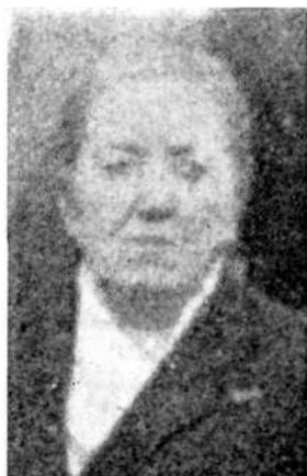
Lokačeva mama, ki je pisala dnevnik

Zapiski tega dnevnika kažejo poprečno žensko v Železnikih, kako se je vključevala in kako je doživljala narodnoosvobodilni boj. Še posebej so ti zapiski zanimivi zato, ker dogodkov med NOB ne prikazujejo v črno-beli luči, ampak življenjsko doživeto in iskreno, čeprav tu in tam tudi nekoliko naivno. Rad bi opozoril na dva posebno zanimiva taka naivna zaključka. 17. januarja leta 1942 je v dnevniku zapisano: »Četniki so se zdaj umaknili. Pravijo, da čez mejo v Italijo.« Zaradi izredno hude zime si ljudje niso mogli predstavljati, kako naj partizani obstanejo, pa so si ustvarili iluzijo o umiku v toplo Italijo. Želja in skrb za naše borce sta ustvarili to lepo iluzijo, ki je bila tedaj zelo živa v Železnikih.