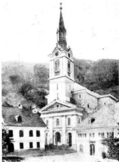
Središče Zeleznikov pred napadom (levo šola, desno mežnarija, kjer je bilo med okupacijo nemško županstvo)

Karte za živila so dobili tisti, ki imajo koga od svojih v Nemčiji na delu, drugi pa ne. Ljudje so čudni. Prej so si tako želeli partizanov, zdaj, ko jih imamo, pa stokajo, ker ni živilskih kart. Obojega pa ne moremo imeti. Saj do zdaj so bili pri nekaterih družinah tako presiti, da ni bila nobena moka dobra, mleka nikdar dovolj. Saj niso vedeli, da je vojska.