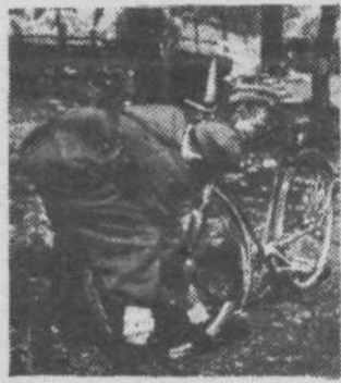
Partizanski kurir-kolesar

Vrata kolesarskega kluba Slovan Rog-Franek so odprta za vse ljubitelje tega naporega, a lepega in zdravega športa. Napor in znoj naj ne bosta ovira, temveč spodbuda za delo in zdravo razvedrilo. MIRO DVORŠAK