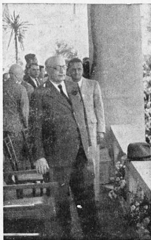
Mednar. mladinski tabor v Ljubljani. Dr. Korošec na tribuni na Stadionu.

obrtnikov, kmetov, meščanstva, poslancev, senatorjev, ministrov, generalitete, revnih in bogatih, lepo oblečenih in strganih, skratka; vseh slojev beograjskega vele mesta. Pri tej priložnosti so se dogajali