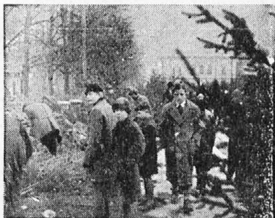
V Ljubljani pred božičem.