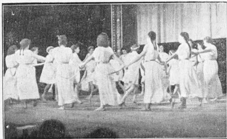
Prizor z mladinske akademije: Rajanje v svobodi.