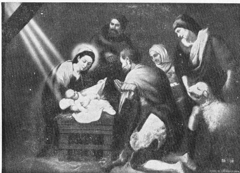
Božič. — Rojstvo.

Tudi električni tok povzroča ožganine. Če je močnejši, človeka takoj usmrti, sicer pa omami. Ponesrečenca je najprej osvoboditi električnega toka s tem, da se tok prekine ali žica odstrani, pri čemer pa je treba mnogo previdnosti. Ne dotikaj se ponesrečenca, dokler gre skozenj električni tok! Tudi električne žice ne prijemlji in se je ne dotikaj s kakršnim koli predmetom! Odstrani jo z leseno