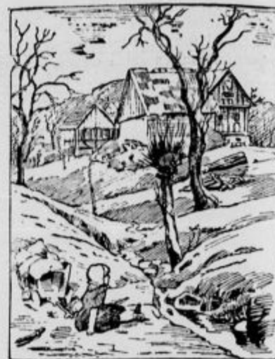
Kje so mati?

LOTERIJSKI ŠTEVILKE. Gradec, 15. aprila: 55, 4, 24, 6, 38. Brno, 15. aprila: 22, 40, 74, 10, 32. Linc, 18. aprila: 54, 40, 47, 36, 67.