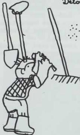
Delo na vrtu

Med počitnicami sem se igrala, gledala televizijo. Malo sem pomagala mami pometati, pospravljati sobo itd.