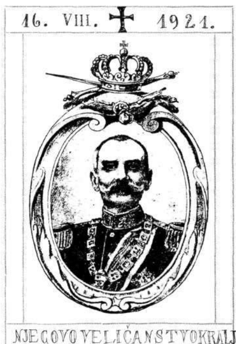
Iz kronike šole v Sorici ob smrti kralja Petra I. 16. avgusta 1921

Vse kronike poročajo nato o poroki novega kralja Aleksandra z romunsko