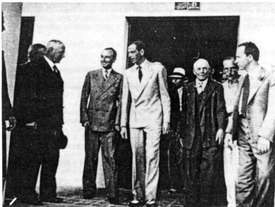
Obisk kneza Pavla in kentskega vojvode Jurija na 1. obrtno-industrijski razstavi v Škofji Loki 16. avgusta 1936 (Zgodovinski arhiv Ljubljana, Enota v Škofji Loki)

Najbolj pa so kronike napolnili opisi tragičnih dogodkov, kakor je bila smrt kralja Petra leta 1921. Zapisi so polni žalosti in velikih besed o njegovih vrlinah in zaslugah.