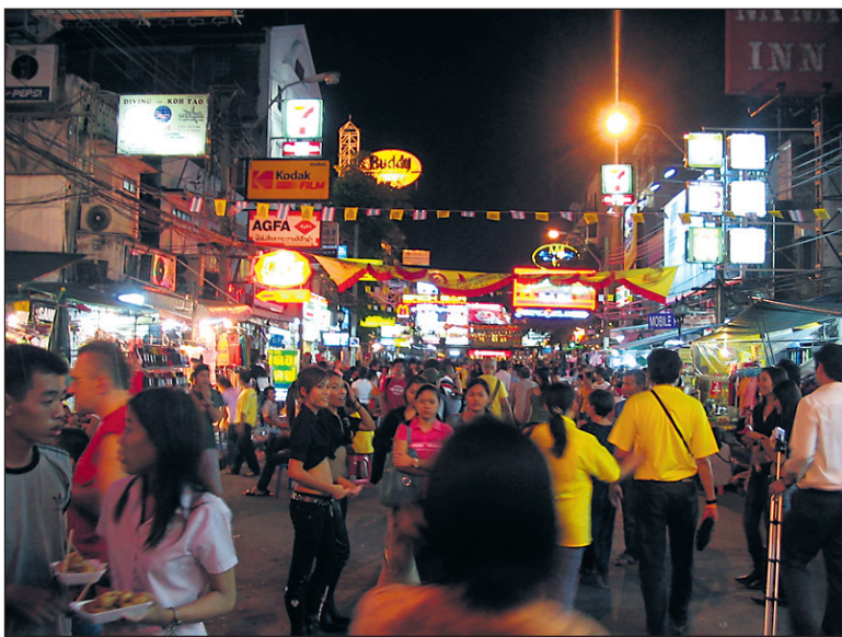
Ulica Khao San Road se zvečer spremeni v človeški panj.

Ko Tao je predvsem ciljna destinacija potapljačev, ki zaradi izjemno dobre podvodne vidljivosti uživajo v raziskovanju koralnih grebenov ali opazovanju pisanih ribic. Na njem boste na svoj račun prišli tudi tisti, ki se radi razvajate na samotnih peščenih plažah z dobro knjigo v roki. V kolikor bi si zaželeli tudi malo pustolovščine, si v najbližji agenciji organizirajte izlet, ki običajno vključuje celodnevno snorkljanje okrog otoka ali obisk naravnega parka Nang Yuan, sestavljenega iz treh samostojnih otokov, ki jih povezuje naravna peš-