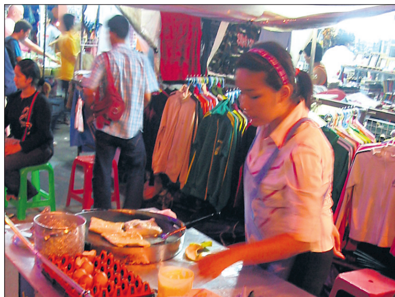
Tajski »fast food« pomeni prehranjevanje na ulici, kjer hitro in poceni napolnite želodec z zelo okusno hrano.