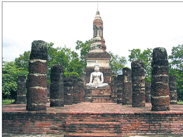
Kip Bude v sedežem položaju v starem delu mesta Sukhothai.