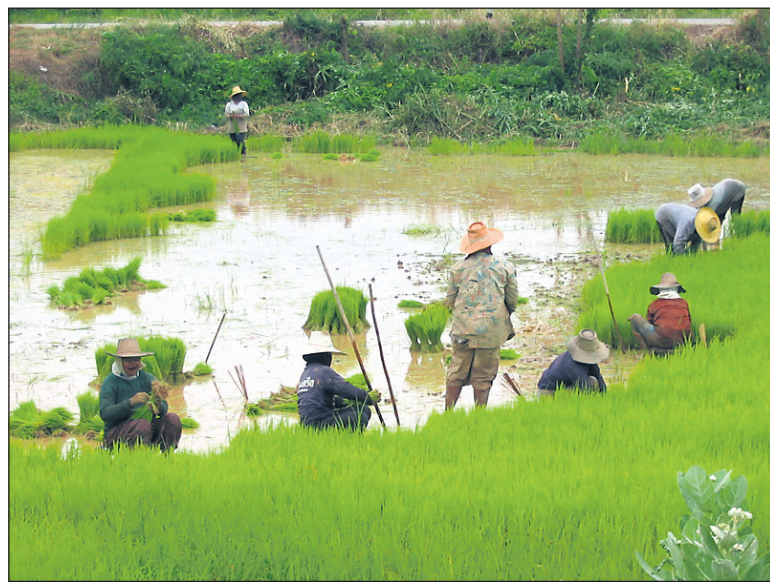
Blatno in mokro presajanje riževih stebel na poljih v okolici mesta Sukhothai.

Najslavnejši izmed trojice arhipelaga Samui, tj. Ko Samui (Otok Kokosa) pa je zagotovo otok, ki je že izgubil svoje nekdanje idilične ribiške vasice in ribiče, ki so metali mreže in se zvečer vračali z ulovlje-