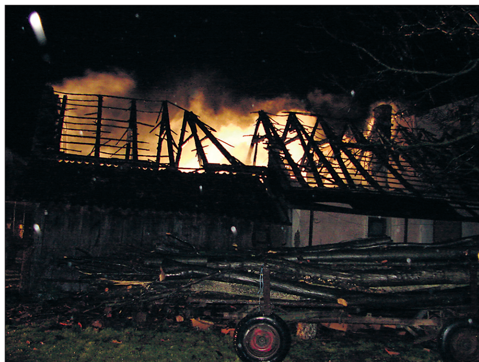
Popolnoma pogorelo stanovanjsko poslopje v Stojncih.