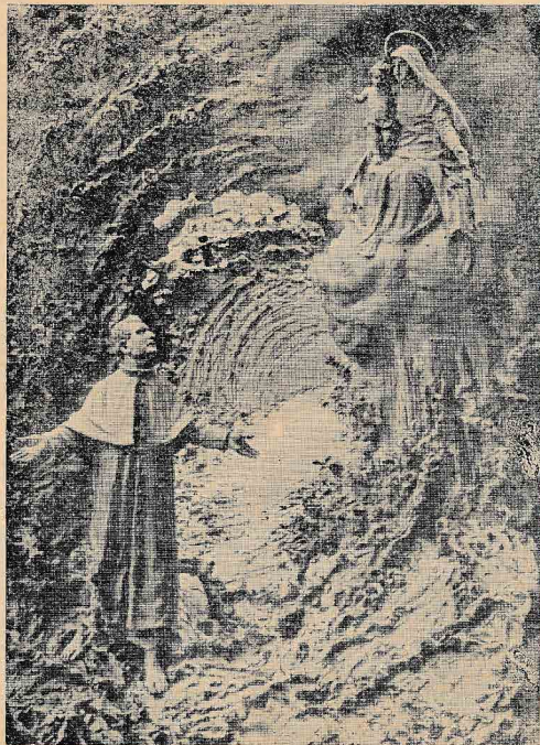
Pod rožami je bilo ostro trnje . . .