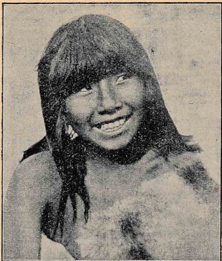
Mladenka iz rodu Onas

vi veri pridejo tisti, ki so slabo živeli, ki so morili, ropali, zlorabljali žene drugih itd., po smrti v globoko brezno, polno krvi, ali v umazano jezero, kjer trpe lakoto in ne dobe pitne vode; tisti pa, ki so pošteno živeli, žive po smrti v gozdih, kjer je polno za jed okusnih ptičev, in pijejo čisto studenčnico in se vesele v brezdelju. Verujejo tudi, da se duše nekaterih presele po smrti v ptiče in žuželke, kakor smo že omenili, govoreč o Konih .