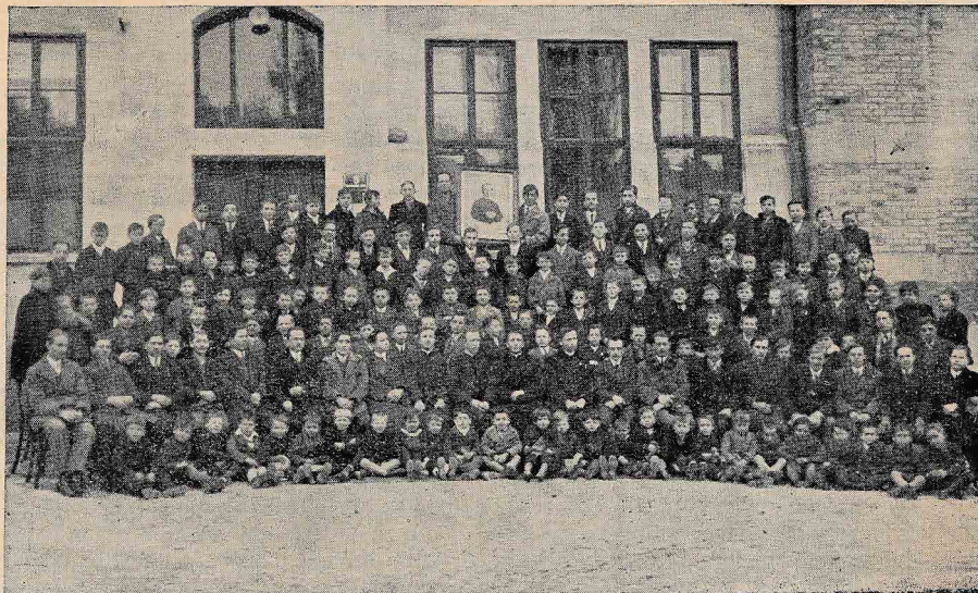
Oratorij bl. Janeza Boska na Rakovniku 1931. l.

In sicer? Vse po starem? Nikakor! Zdi se, da se na Rakovniku pripravlja nekaj velikega. Dan na dan brni pred zavodom tovorni avto, gasi se apno, v zavod prihajajo pomembni obiskovalci. Za sedaj to dejstvo samo opazujemo; presodili pa ga bomo pozneje, ko zremo za njegov namen in pomen.