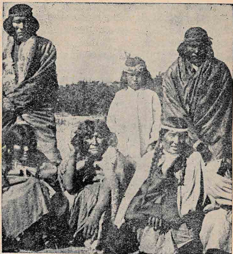
Krščena družina iz divjega rodu Tehuelki

Misijon kljub težavam obljublja lepe sadove. Kar se tiče ozračja, si ne moremo želeti boljšega: kraj je zdrav in brez mrzlice.