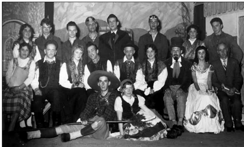
Spevoigra Pri belem konjičku, Reteče, 1958.

Trojarjeva: Mogoče res tudi to. Pa sodelovanje v različnih krožkih že v osnovni šoli v Retečah, v dramskem in pevskem, pa stiki z ljudmi, otroki in odraslimi ... In seveda želja, da bi razdal naprej tisto, kar sam gledaš, vidiš, čutiš.