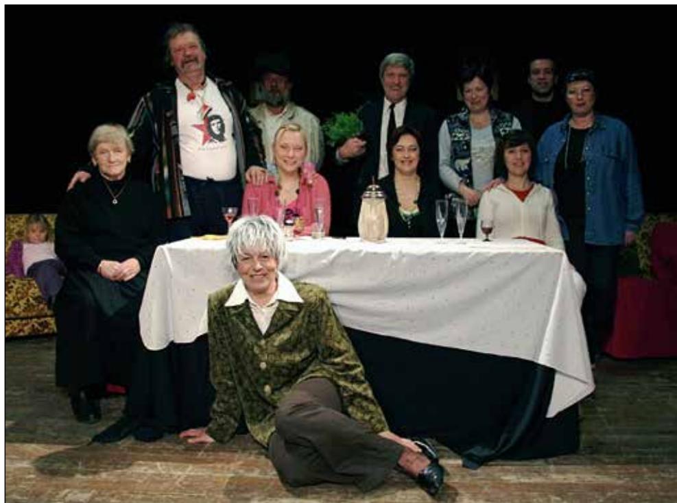
Režiserka Ladi Trojar in igralci KUD-a France Koblar v črni komediji Mama je umrla dvakrat , 2008.