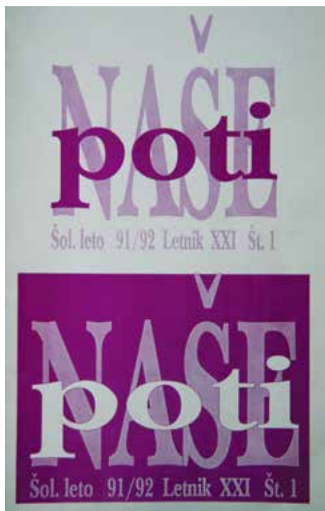
Slika naslovnice glasila ob 175-letnici šolstva v Železnikih.