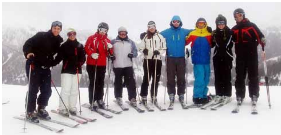
Smučarski izlet v Innerkrams