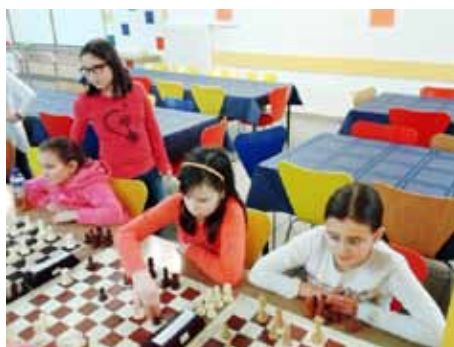
Zlata dekleta za šahovnicami

Zahvaljujemo se vodstvu šole kot tudi staršem za pomoč pri prevozih in za dobro sodelovanje, da bi otroci dosegali še boljše rezultate.