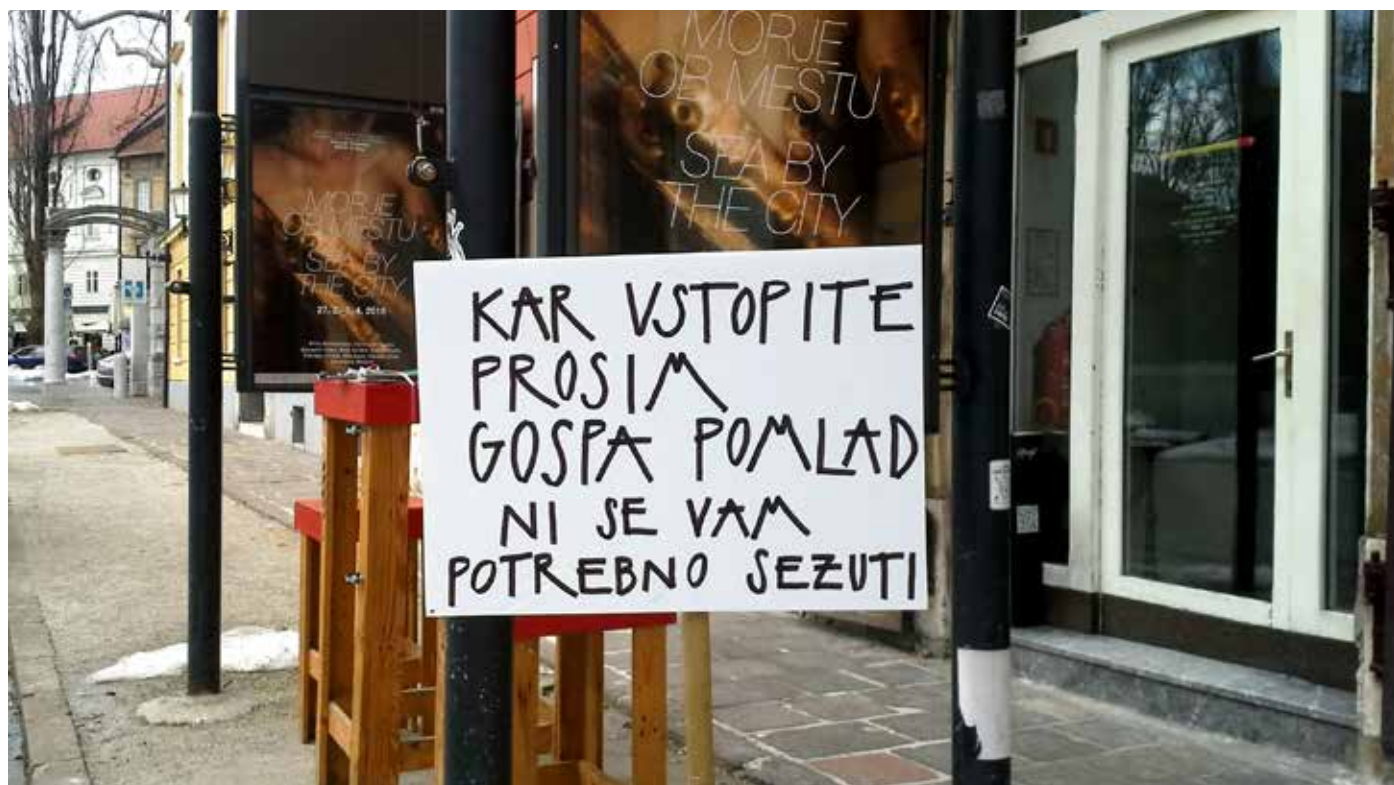
Takole je nekdo sredi marca v Ljubljani »v obupu« iskal letošnjo pomlad in jo nazadnje le dočkal konec meseca.