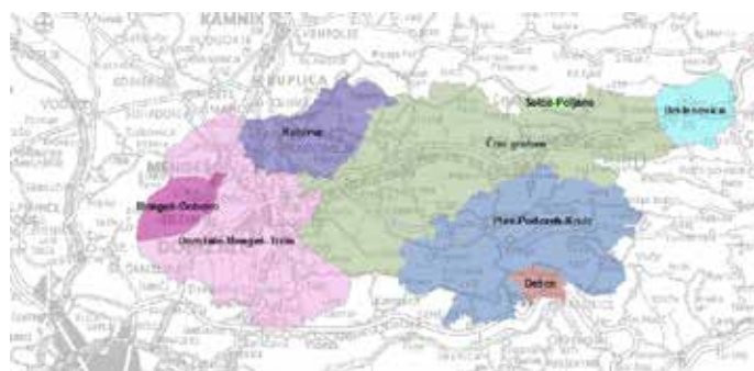
Slika prikazuje osem območij oskrbovanja s pitno vodo iz vodnih virov, ki jih upravlja Javno komunalno podjetje Prodnik.

kolikšni koncentraciji. Med koncentracijami preskušanih parametrov v pitni vodi naših oskrbovalnih območij ni bistvenih razlik.