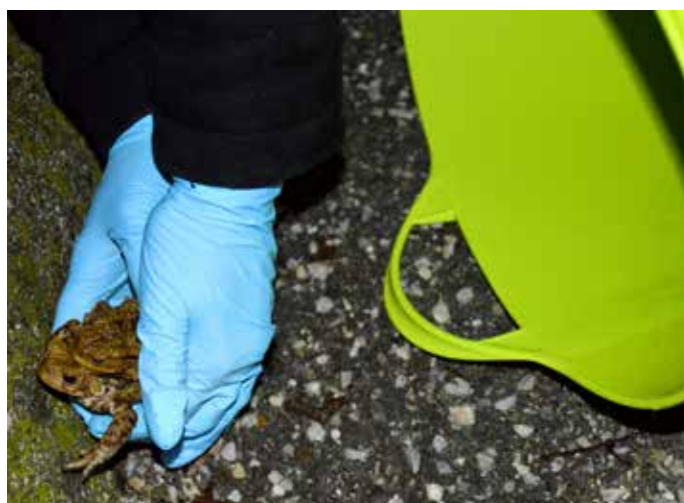
Previdno in nežno prenašanje žab s ceste na varnejšo pot proti bajerju

Krastača se pred naravnimi sovražniki brani z izločanjem strupa, ki pa človeku ni nevaren. Paziti je treba le, da ga ne dobimo v oči, usta ali odprto rano, saj bi lahko povzročil vnetje sluznice ali pekočo bolečino. Zato si je, če prijemamo krastačo brez medicinskih rokavic, to je rokavic brez smukca, roke takoj po tem priporočljivo umiti.