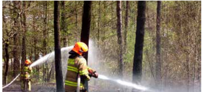
Gašenje gozdnega požara