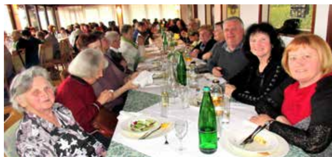
Množična udeležba na občnem zboru društva Jesenski cvet