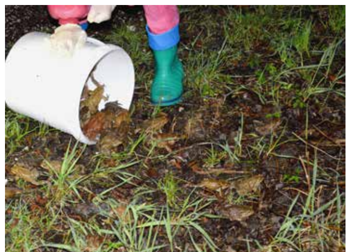
Rešene žabice so nehale »jokati« in so hitro odrzleze.

Več o akcijah prenašanja žabic na spletnih straneh: pomagajmo-zabicam.si • Tanja Jankovič