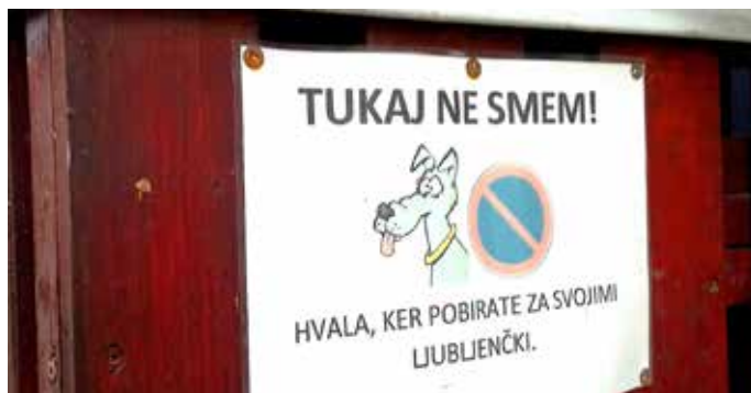
Dve trzinski jezikovni rešitvi za isti problem. Povod za obe obvestili so seveda nevestni pasji lastniki, ki ne pospravljajo za svojimi ljubljenci!

Štirinožni ljubljenci se v nekaterih ulicah in po trzinskih blokkih nezadržno množijo, te večinoma nadvse ljubke zverin(ic)e pa imajo to slabo navado, da se rade tudi pokakajo, in to skoraj kjer koli in kadar koli. Tej navadi pravzaprav ne moremo nič očitati, slabo navado pa imajo njihovi lastniki in lastnice, ki za svojimi ljubljenci ne pospravljajo njihovih iztrebkov. In ko postane ta navada železna srajca, lahko pojavnost teh primerov »eskalira« v tovrstne napise. Žalostno pri tem pa je, da jih na ta račun pogosto slišimo tudi tisti lastniki psov, ki smo vestni pobiralci pasjih kakcev. Kakor koli že, zdi se, da je v opisanem primeru lastniku napisa bližje rimanje kot izbiranje za javno objavo primernih besed. V Slovarju slovenskega knjižnega jezika (SSKJ) lepo piše, da sta besedi srati in sranje vulgarnizma (in ju podčrta tudi črkovalnik programa Word, če nastavite kot jezik za preverjanje slovenščino). Gre torej za besedi, ki sta glede na moralna in družabna pravila v jezikovnem smislu zelo neprimerni. Da se da isto povedati tudi drugače, pa kaže primer iz sosednje trzinske soseske, T 3, kjer so se priprave in izdelave