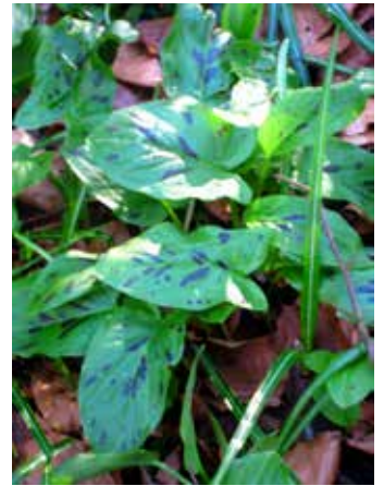
Katja Rebolj drži v roki mlade lističe strupenega kačnika. Odraslo rastlino zlahka prepoznamo po lisah na listih in po zelo pekočem okusu, kar nas oboje opozori na nevarnost.