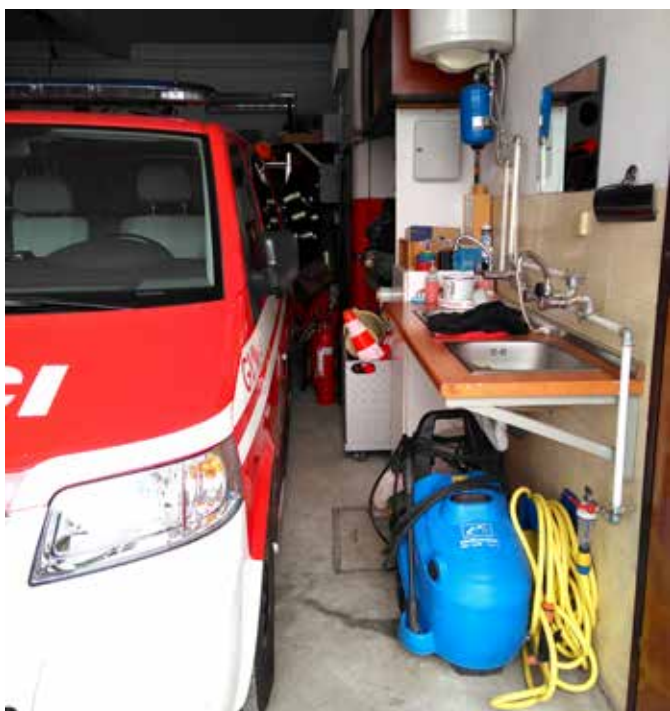
Pogled v notranjost trzinskega gasilskega doma

Upravni odbor in poveljstvo Prostovoljnega gasilskega društva Trzin, foto: Arhiv PGD Trzin