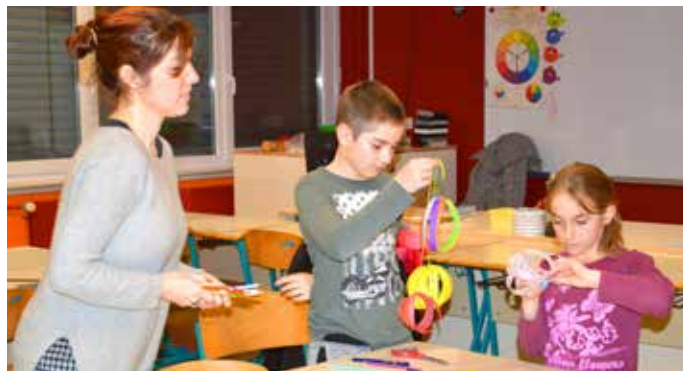
Velikonočne delavnice sta se udeležila le dva nadobudneža, ki pa sta se zavzeto in navdušeno posvetila izdelavi pisanih prazničnih lampijončkov.