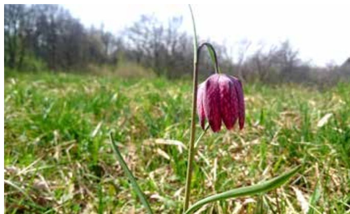
Žerjavček, spomladi cvetoča rastlina iz družine lilijevk, je upodobljen tudi v trzinskem grbu.

To je eden od razlogov, da je Občina Trzin v sodelovanju z Zavodom RS za varstvo narave iz Kranja območje Blatnic 19. oktobra lani (2017) začasno zavarovala kot naravni rezervat. A Blatnice niso pomembne samo zaradi žerjavčkov, temveč tudi zaradi zadnjega ostanka nekoč obsežnih hrastovih dobrav, obvodnega gozda in ohranjenih mokrotnih travnikov in logov z veliko pestrostjo rastlin in živali. Pšata je ohranila svoj prvotni poplavni značaj le še tu, na območju Blatnic in sosednjega Dragomlja, in je to njeno najobsežnejše in najizrazitejše poplavno območje. Samo tu so še ohranjene njene prvotne lastnosti, kot so vijugasta struga in mokrotni travniki z močvirskimi tulipani. To so zadnji ohranjeni dragulji nižinskega sveta osrednje Slovenije, ki skrbijo za to, da je voda čistejša, da je ta svet zavarovan pred poplavami in sušami