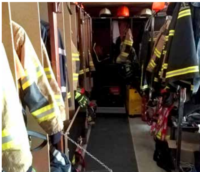
Za silo urejena garderoba v garaži

Tako je bilo videti delo operativnega gasilca na intervenciji PGD Trzin v letu 2017.