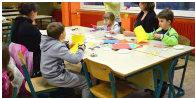
V žaru ustvarjanja rožnatih obešank