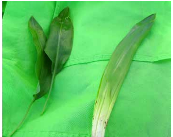
Levo čemaž, desno podlesek. Čemaž in podlesek imata oba rada mokra tla, zato ju lahko najdemo na istih rastiščih in je veliko možnosti za njuno zamenjavo, medtem ko so šmarnice rade bolj na suhem, in je verjetnost zamenjave zato manjša. Ob trzinskem bajerju ne raste čemaž, tam raste strupeni podlesek!