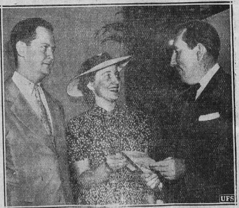
Na sliki (na desno) vidimo senatorja Pepperja iz države Floride, ki je bil glavni govornik na kongresu mladih demokratov, ki se je vršil zadnji teden v Washingtonu.