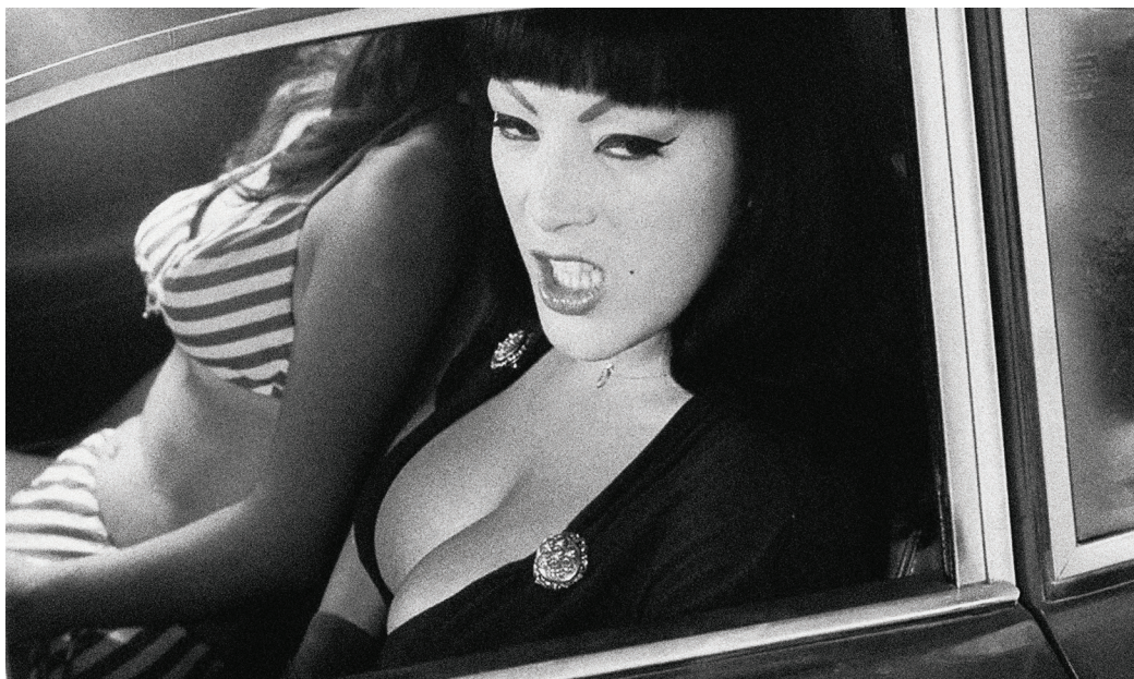
DAJ, MUCKA, UBIJ, UBIJ! | 1965

Od nekdanj sem bila fascinirana nad junakinjami, ki se obnašajo kot moški, predvsem ker se mi je zdelo, da je njihovo življenje veliko bolj zabavno kot pa tisto, v katerega so »tradicionalno« zaklenjene ženske na platnu (še bolj kot seveda v sami realnosti). Seveda je bilo takih junakinj v mojih letih ždenja pred televizijskim ekranom bore malo (še dobro, da smo imeli vsaj Ksena [Xena: Warrior Princess, 1995–2001] in Buffy [Buffy The Vampire Slayer, 1997–2003]).