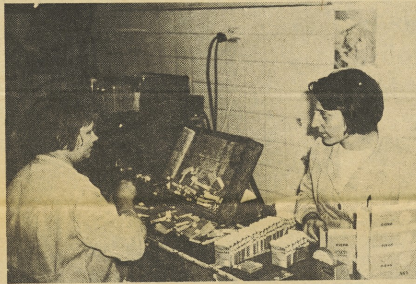
Iskra-baterije Zmaj, Ljubljana. — Posnetek kaže delavki pri finalizaciji baterij z oznako R 6, potem ko so le-te prestale natančno končno kontrolo, s katero elektronsko ugotavljajo kakovost tovrstnih baterij.