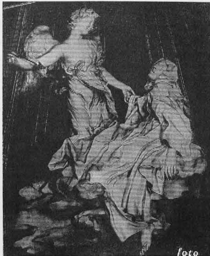
V četrtek 15. oktobra so se pričele v Španiji proslave ob IV. stoletnici smrti sv. Terezije iz Avile. Sv. oče je imel namen, se tega praznovanja osebno udeležiti. Atentat je to namero preprečil. Zato je kot svojega zastopnika poslal v Španijo turinskega nadškofa kardinala Ballestrera, ki kot sv. Tereza pripada karmeličanskemu redu.

■ Na Japonskem je prišlo do hude nesreče v premogovnem rudniku, ki leži na otoku Hokajdo. V globini 650 m je zaradi uhajanja plina metana nastala eksplozija, pri čemer je bilo ob življenju 93 rudarjev.