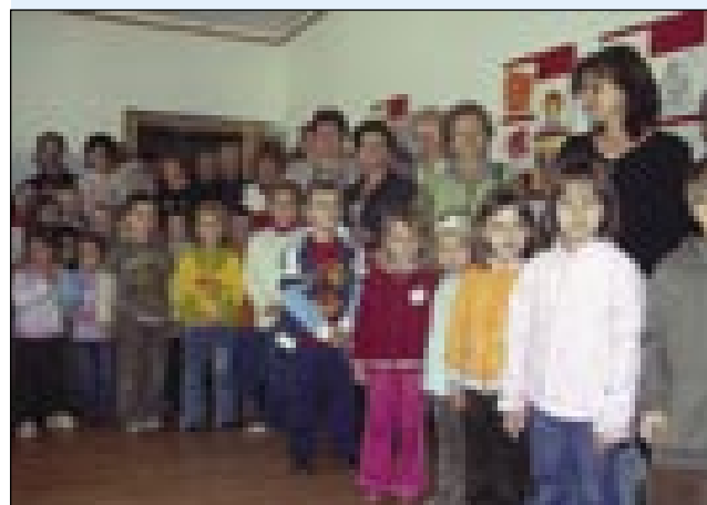
Na otvoritev so prišli malčki iz več vrtcev

Vrtec Murska Sobota že deset let sodeluje z Zvezo Slovencev na Madžarskem, z denarno pomočjo katere se odvijata strokovno svetovanje in pomoč, ki ju vzgojiteljice iz Vrtca Murska Sobota nudijo petim porabskim vrtcem. Že peto leto pa Vrtec Murska Sobota organizira mednarodno likovno kolonijo, katere se udeležujejo tudi porabski malčki in njihove mamice. Največkrat so sodelovali malčki z Gornjega Seni-