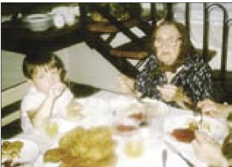
Prababica s pravnikom