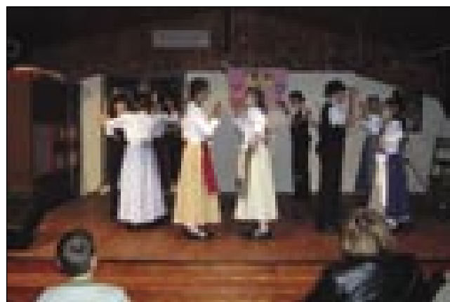
Nastop v Subotici