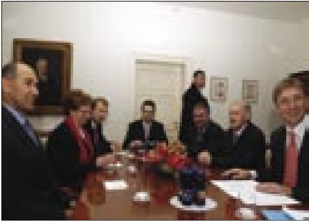
Premiera Gyurcsány in Janša sta sprejela tudi predstavnike obeh manjšin

Po tem, ko je Janez Janša ocenil pomen članstva Slovenije in Madžarske v Evropski uniji in vstop v schengensko območje, ko bodo kmalu »padle zadnje meje ned nami,« je o gospodarskem sodelovanju povedal: »Z zadovoljstvom ugotavljam, da je prišlo do pomembnega povečanja obsega trgovinske menjave, ki je lani prvič pre-