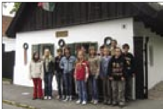
Pri Petőfijevo rojstni hiši

Zadnji smo nastopili mi iz Porabja. Skoraj 20 minut smo bili na odru, in lahko pove-mo, da smo zelo uživali, ker smo čutili, da je publika vmes ploskala in zapela z nami.