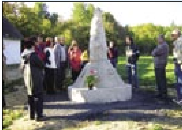
Pri „malem Triglavu” v Andovcih

Člani Zbora atletskih sodnikov iz Murske Sobotice so si zadnjo prelepo sončno nedeljo ogledali Porabje. Čez mejni prehod Čepinci smo zavili v Andovce, kjer nas je pričakal predsednik