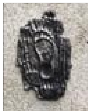
Simbolična stopinja sv. Martina (Šmartno na Pohorju)