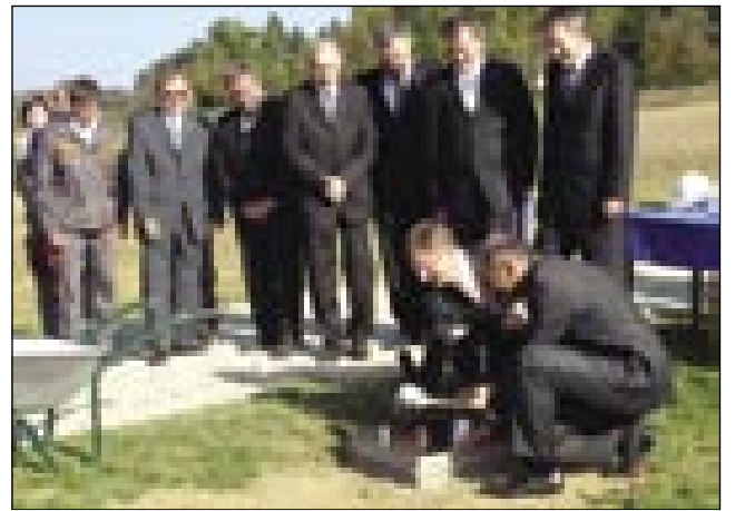
Položitev temeljnega kamna za cesto med Gornjim Senikom in Verico

Seniku se dogovarjajo za skupno financiranje s Slovenijo. Bolj na pripombo kot na vprašanje, da Slovenija daje mnogo več denarja prekmurkim Madžarom kot Madžarska Porabskim Slovencem, je madžarski premier povedal, da to verjetno drži, Janez Janša pa dodal, da »Slovenija ne bo zmanjševala sredstev, ki jih prispeva za ohranjanje identitete in za razvoj madžarske narodne skupnosti v Sloveniji. Nove možnosti in finančne vire bosta manjšini dobili tudi po regionalizaciji Slovenije.«