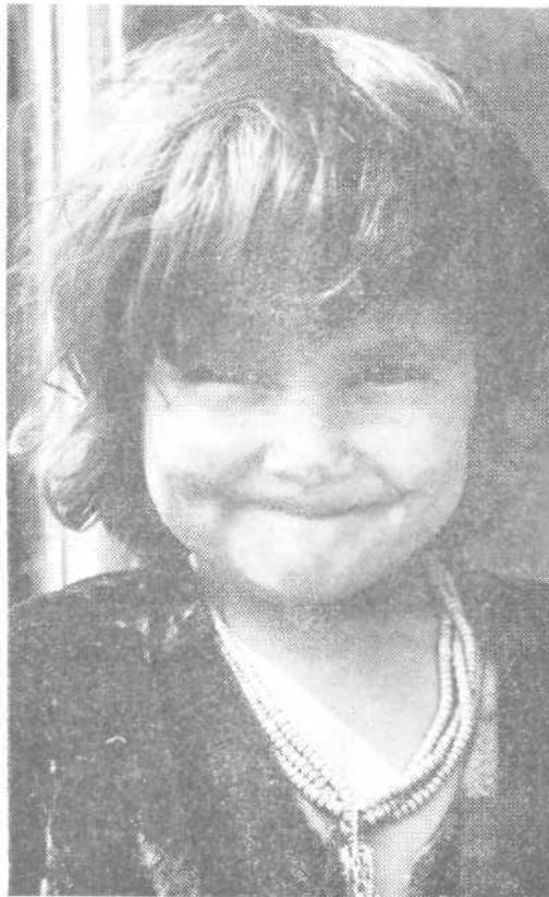
Stric, slikaj me...

• »Eh, zadnjič me je neki tip ustavil v Tivoliju, ko sem pometal. Odkod si, me je vprašal. Kako živiš? Rekel je, da je od časopisa in če imam malo časa za razgovor; če ne, bo prišel spet potem, ko bom končal z delom. Ha, ta ti