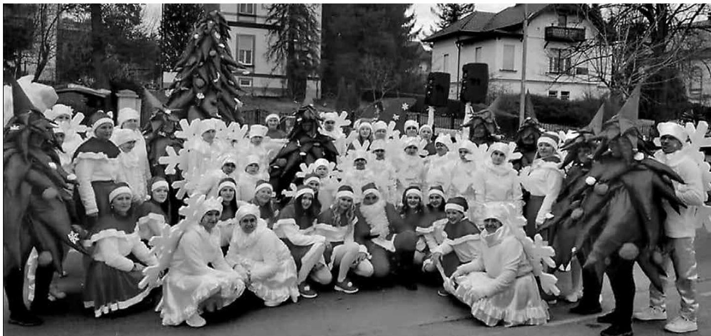
60. tradicionalno kurentovanje na Ptujju.

pripeli na puloverje. Sešili smo bele kape, šale in krila. Naše plesalke smo poimenovali božičkove in jim tako sešili rdeče kostume. Prav te so se pridno pripravljale na plesno točko, ki je bila za našo skupino zelo pomembna. Tako smo sestavili smreke, snežinke, božičke in božička ter se na povorke prijavili z naslovom Naš božič. Izrezali in sestavili smo veliko smreko, sani in jelene, ki so krasili naše prevozno vozilo, s katerim smo se predstavljali na povorkah. Izbrali smo še božične melodije, na katere smo se učili plesati na vajah. Šivali, izdelovali in pripravljali smo se dan za dnem, saj so se bližali dnevi, ko smo morali nastopiti.