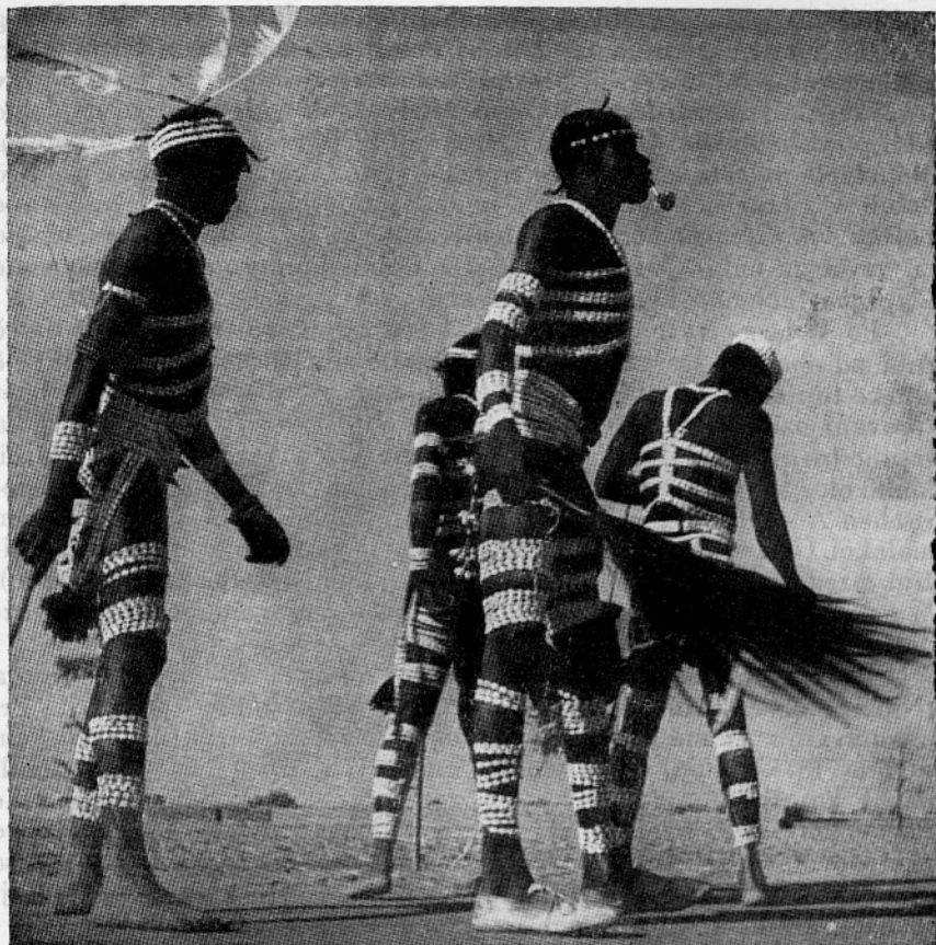
Sl. 5. Zamorci iz francoskega Sudana pri plesu, opravljeni z na vrvcih nanizanimi lupinami belih kavrijev. Iz Geographic Magazine

mogli dosevati k nam po kratki in neposredni poti. Za starejše obdobje, t. j. od neolitika pa do časov, ko se je razvila plovba po morju na veliko razdaljo, je verjetnejša kopenska pot; za novejše čase pa pride v poštev bolj morska pot.