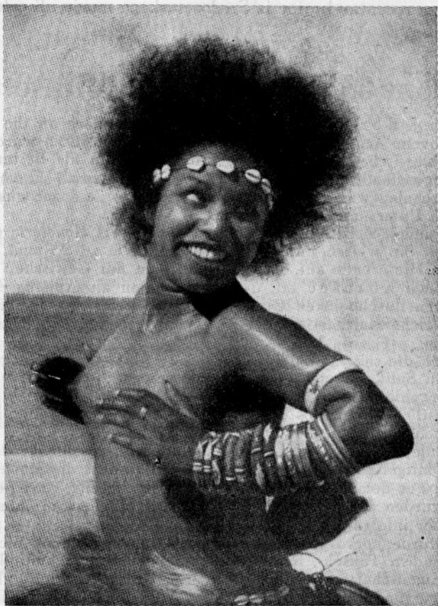
Sl. 4. Libijska plesalka (Mayoni). Okrog čela in pasu ima vrvice z nanizanimi belimi lupinami kavrija. Iz Geographical Magazine

V novejših časih je trgovina s kavriji bila v rokah zlasti Holandcev (dokler so imeli Ceylon) in je Rotterdam bil središče, od koder so prodajali kavrije v Gvinejo. Nekaj časa se je vsa trgovina z afri-