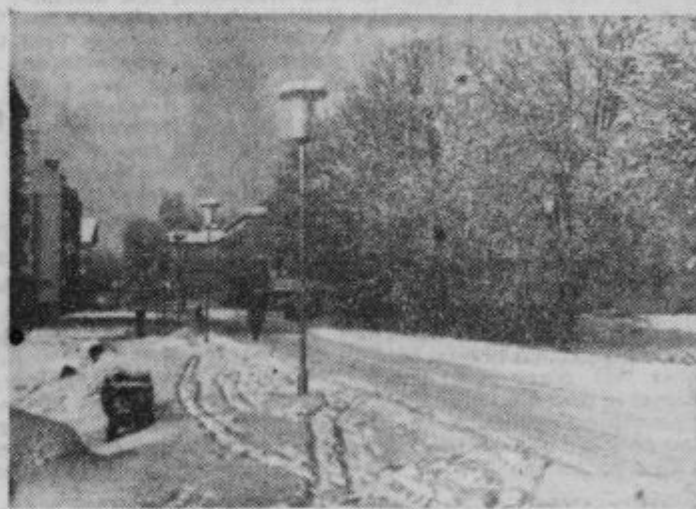
Ciril-Metodov drevored v Ptujju Novozgrajeni del tovarne

Na osnovi sklepov VI. plenuma Občinskega sindikalnega sveta Ptuj je bil 3. februarja t. l. v Ptujju enodnevni seminar sindikalnih delavcev iz sindikalnih podjetij sindikata delavcev kmetijstva in živilske industrije. Razveseljivo je, da so se seminarja udeležili tudi sindikalni delavci iz sosednih občin: iz Slovenske Bistrice in Lenarta v Slovenskih goricah, ki so s svojo udeležbo vidno prispevali k uspehu seminarja. Na seminarju so razpravljali o delitvi dohodka in primerjavi pogojev gospodarjenja in poslovanja med delovnimi organizacijami iste panoge na temelju enotnih pokazateljev. Nadalje so se pogovorili o nalogah delovnih kolektivov glede na družbeni plan občine za leto 1964 na področju kmetijstva in živilske industrije. Izmenjali so mnenja o vsebinskih problemih, ki se pojavljajo ob izdelavi, razpravah in sprejemanju statuta. Posebno pa so se zadržali na vprašanju, kako v kmetijstvu in v živilski industriji ustvariti pogoje za skrajšanje delovnega časa. Ostala razprava je bila osredotočena na vsebinske priprave letnih občnih zborov in na delovne programe sindikalnih podružnic za leto 1964. Seminar je v celoti uspel, ker so razgovor vodili zelo izkušeni predavatelji in tajnik Republiškega odbora sindikata delavcev kmetijstva, živilske in tobačne industrije Slovenije iz Ljubljane. Smernice tega seminarja so sindikalnim delavcem dale napotke, kako naj se lotijo priprav in o čem naj predvsem razpravljajo na letnih občnih zbora. FB