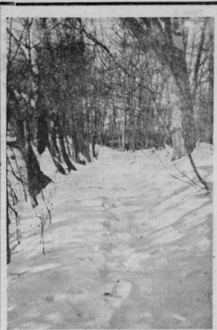
Zima se poslavlja, ali res že do končno?

»Tednik« izhaja pod tem skrajšanim imenom od 24. nov. 1961 dalje na predlog Občinskih odborov SZDL Ptuj in Ormož. — Izdaja zavod »Tednik«, Ptuj — Odgovorni urednik: Anton Bauman — Uredništvo in uprava Ptuj, Lackova 8 — Tel. 156 — Št. tek. računa: NB Ptuj 604-19-603-72 — Tiska časopisno podjetje »Mariborski tisk« — Rokopisov ne vračamo. — Celoletna naročnina za tuzemstvo 1000, za inozemstvo 2000 din