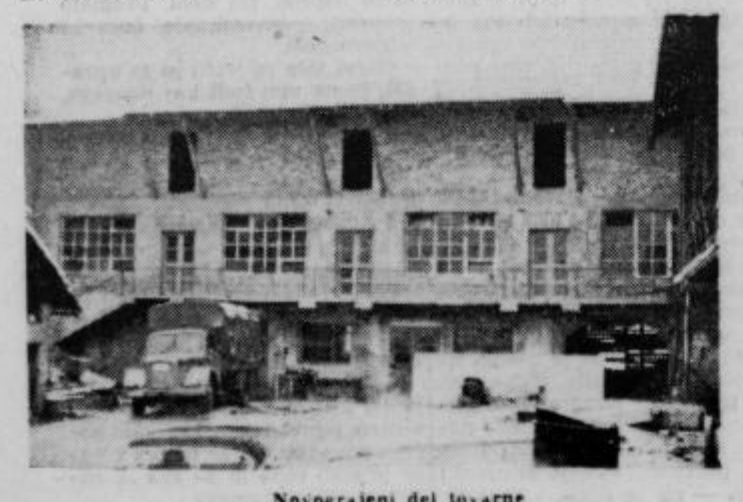
Novozgrajeni del tovarne

Tokrat pri njem ni to prvi primer, saj je bil med letom že disciplinsko kaznovan zaradi sličnih dejanj. DS gostinskega podjetja je na svoji seji dne 30. januarja 1964 sklenil prekiniti delovno razmerje s tistimi, ki so si protizakonito prisvajali denar in s tem podjetju povzročili škodo. Večkrat pa je dejstvo, da do prisvajanja v gostinskem podjetju ni prišlo iz potrebe, saj je do tega prišlo prav pri zaposlenih skoraj z največjim osebnimi dohodki. To je postala epidemija, ki je skoraj zajela celotni stari vodilni kader gostinskega podjetja.