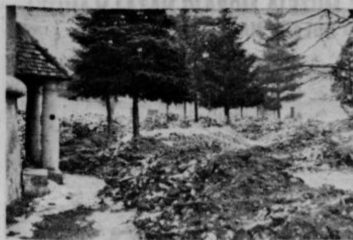
All v Ptujju ni primernejšega prostora za odlaganje nesnage z mestnih ulic kakor je park?

V neugoden položaj zapadajo brez potrebe nekateri davčni zavezanec, ki ne morejo drugače poravnati svojih večletnih davčnih obveznosti z dražbo njihovih zemljiških površin. Ob pravilnem razumevanju kmetijskih zadrug, bi bile njihove težave mnogo manjše, če bi druge odkupile njihove parcele pod določenimi, vendar za zadrugo in za zavezanca ugodnimi pogoji. Tako pa se dogaja, da še kažejo ponekod vodstva zadrug na zunaj napram zavezanecem nekoristno sentimentalnost, na drugi strani pa spravljajo z zavlačevanjem zadeve zavezanca v še večja bremena in v neugodnejše prodajne pogoje. Če bi se zadruge takoj pobrignile za odkup v dražbo poslanih parcel, bi se zadeva takoj končala. Zavezanecem bi ostalo tako vsaj nekaj možnosti za preživljanje, v drugačem primeru pa padejo naravnost v breme družbi. Tozadevno je Kmetijski kombinat Ptuj napram ljudem bolj prožen in je tudi delo z njim mnogo lažje, ker se zanima za zadeve in jih poskuša tudi po svojih možnostih pravilno rešiti.