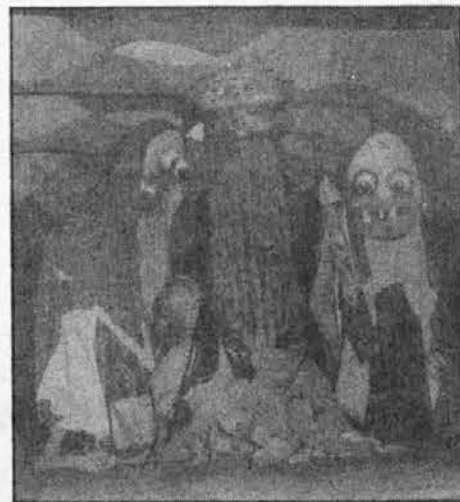
Izvrstne maske zlobnih čarovnic.

V programu smo izvedeli, da je igra nastala na Češkem, od koder je tudi režiserka Katerina Zahradnikova kakor tudi zamisel lutk in mask.