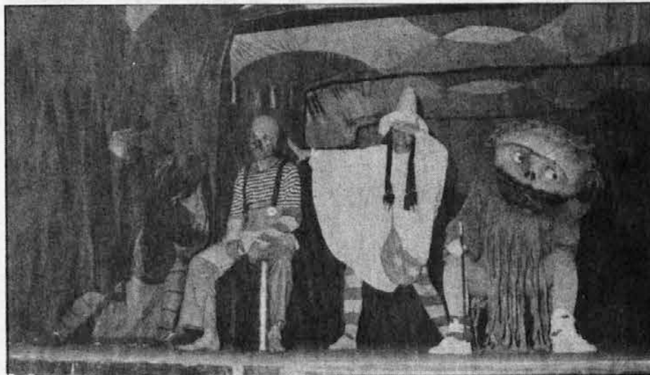
Zgoraj: Mala čarovnica je zmagala nad staro. — Spodaj: Slovenski šolarji so napolnili veliko dvorano v Slovenski hiši.

Vsem, ki so tako bogato pripravili naše začetno šolsko proslavo, predvsem pa gostom iz Maribora, najlepša zahvala.