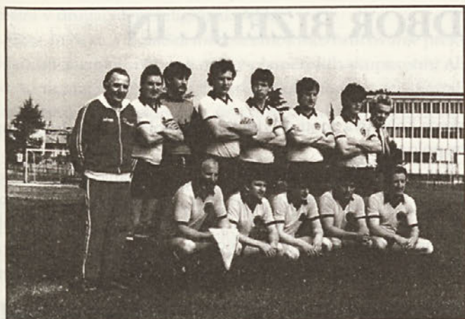
Nogometni klub Cezar iz Kobarida na prijateljski tekmi v severni Italiji, 1988, fotograf neznan.

in podobna vprašanja skuša po svojih najboljših močeh odgovoriti avtor naloge.