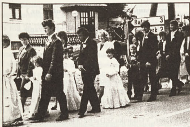
Prvoobhajanci gredo s starši v sprevedu v cerkev, Otočec, 1990.

Maja nam po ženski veji predstavi družinski album svoje rodbine. Začne pri pradedu in prababici (Francu in Ani