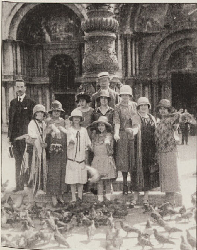
Na obisku v Benetkah leta 1924.