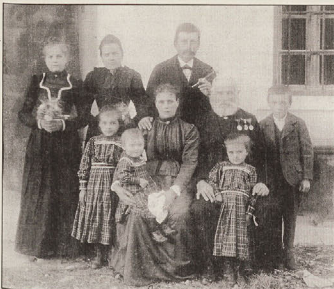
Oblačilna kultura v Sp. Bitnjah pod Premom leta 1902.