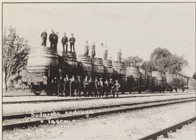
Železniška postaja v Vižmarju okrog leta 1935; Odpošiljanje sodov.