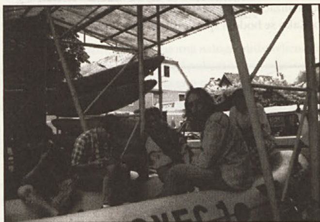
Vodiči Kajak-kanu centra v Bovcu leta 1992.

mladeničev - tistimi, ki delajo za Kajak-kanu center, in tistimi, ki so zaposleni pri Soča rafting. (Ti dve podjetji sta v letih 1991-93 bili pravo bitko za prevoz gostov po Soči.) Prvi so pijanci, vendar prijazni, domači in zabavni, drugi so šminkerji, vendar dobro opremljeni in v službi trezni. Katerim bi krmilo zaupali vi?