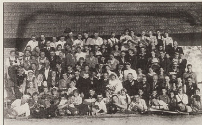
Poroka mlinarjeve hčere leta 1951 v Grabi v Cogetincih.