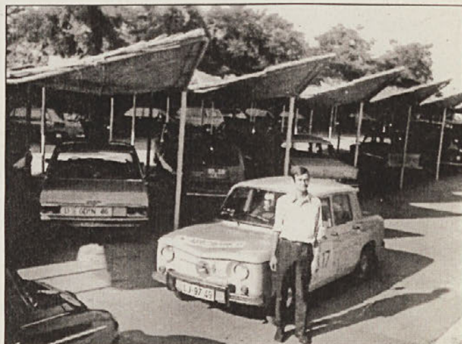
Rally leta 1971.