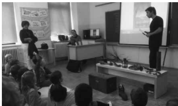
Slika 3: Obisk kustosa iz Goriškega muzeja