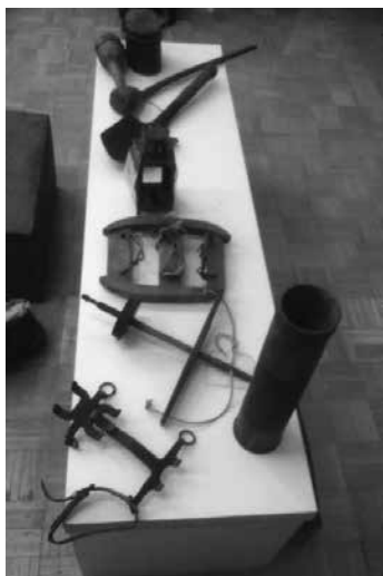
Slika 4: Predmeti iz prve svetovne vojne

Učenci so si ogledali tudi fotografije spomenikov, postavljenih v spomin na padle slovenske vojaške, ki so se na okopih v avstro-ogrskih vojaških uniformah borili za domovino ter lepše in boljše življenje. Krvni davek je terjal okoli 35.000 ljudi. S padlimi slovenskimi vojaki je povezan tudi običaj množičnega obiskovanja pokopališč na dan mrtvih, ki je nastal v času prve svetovne vojne.